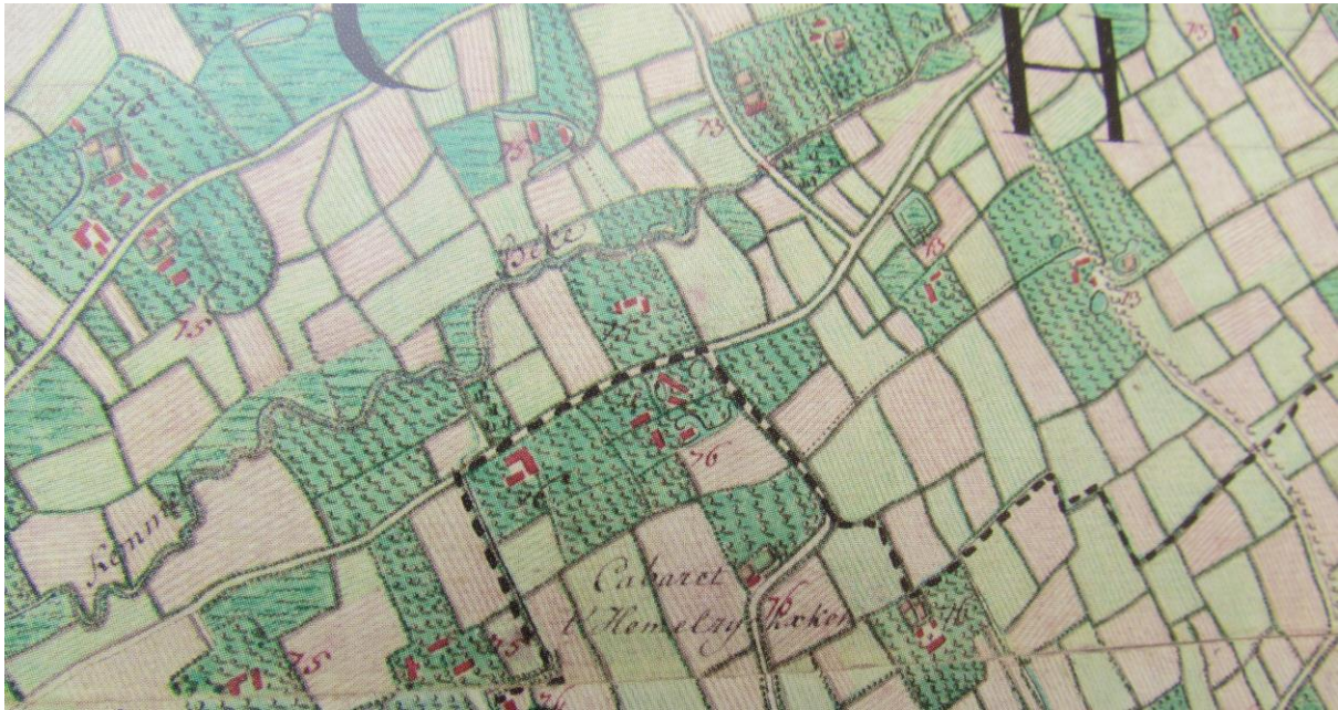
Uit de atlas FERRARIS 1777 – fragment van de kaart 5 B