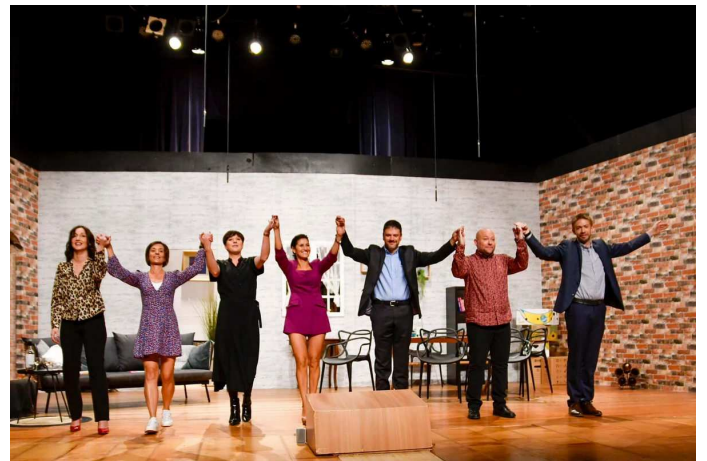
Nouveau succès pour la troupe Coup de théâtre qui a joué la pièce «Les Belles-sœurs» de Eric Assous avec une mise en scène de Bernard Boxus applaudie par près de 1000 personnes!