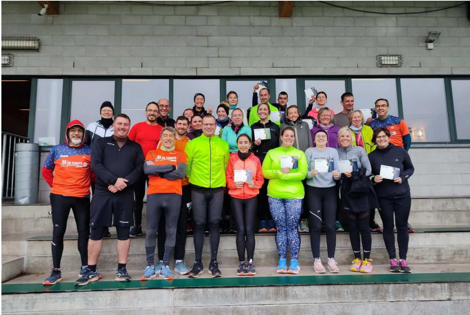
Test final « Je cours pour ma forme »