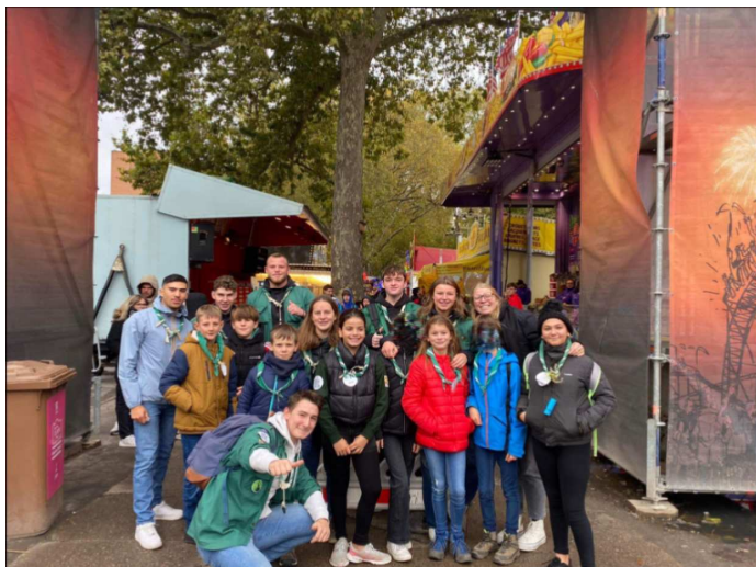
Le staff louveteau

Distribution de soupe aux paroissiens à la sortie de la messe