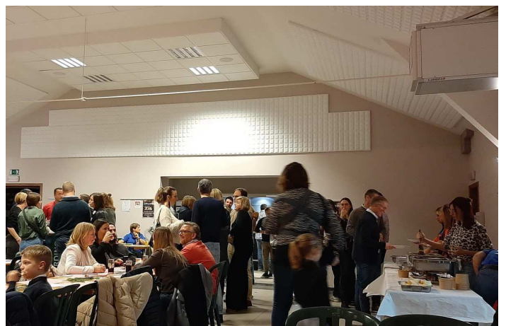
Un vrai succès pour le souper tartiflette du comité des parents des écoles de Faimés

D'autres photos disponibles sur le site faimonsnous.be