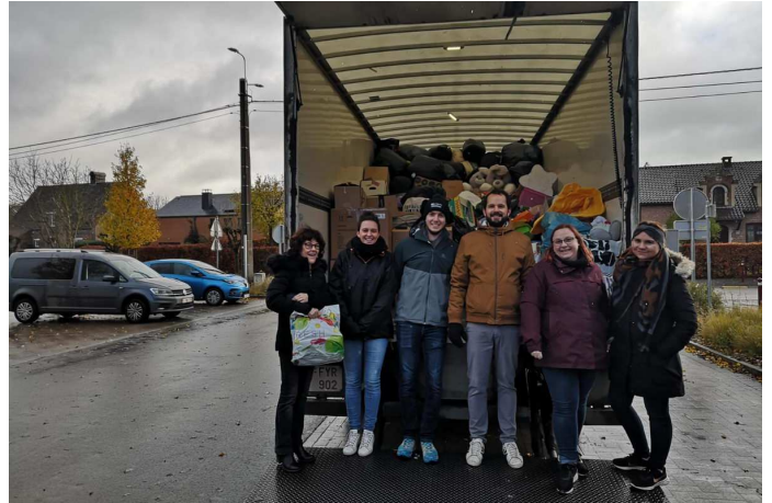
La collecte de vêtements par le comité des parents