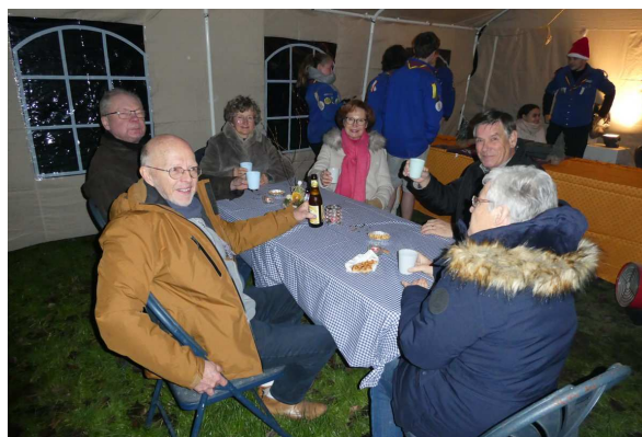
Marché de Noël au Château de Les Waleffes