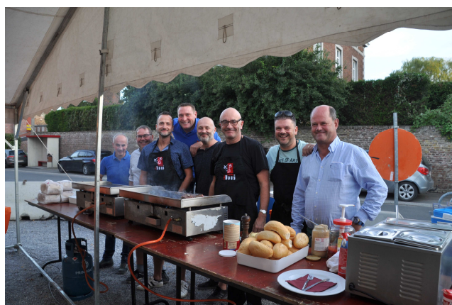
Festivités à Les Waleffes : pétanque et repas plancha D'autres photos disponibles sur le site faimonsnous.be