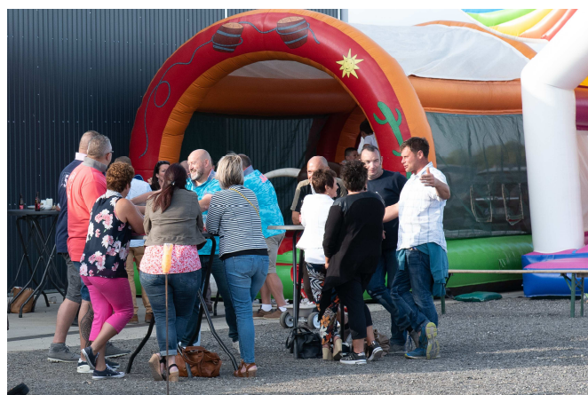
Aineffe en fête

D'autres photos disponibles sur le site faimonsnous.be