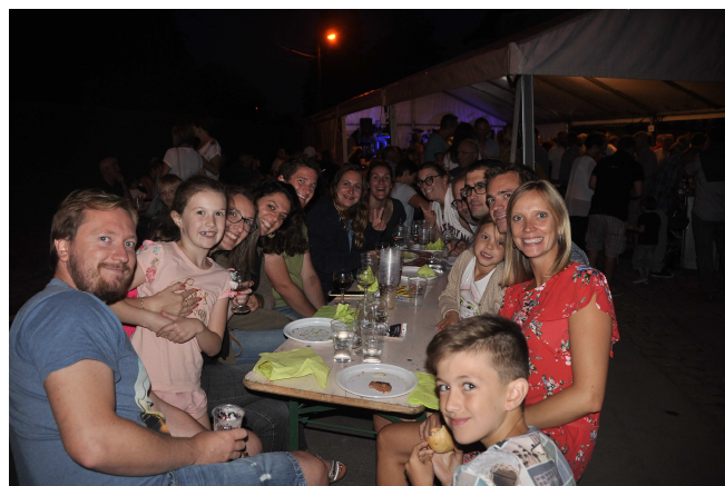
Apéros famois à la chapelle de Saive