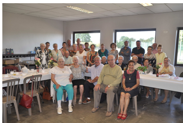
Goûter des pensionnés de Viemme