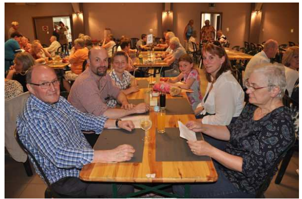
Week-end frites d'Une main à l'Autre