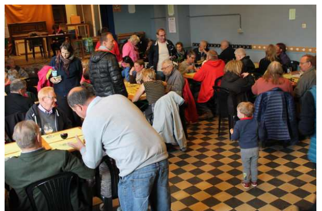
Merci à tous les pâtisseries bénévoles qui ont soutenu la marche ADEPS du 1 er mai à Les Waleffes ainsi qu'aux nombreux marcheurs

D'autres photos disponibles sur le site faimonsnous.be