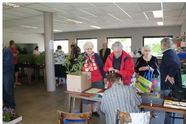
Foire aux plantes par le Cercle horticole de Faimés