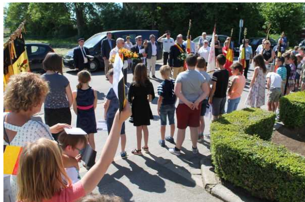
Commémoration du 8 mai

D'autres photos disponibles sur le site faimonsnous.be