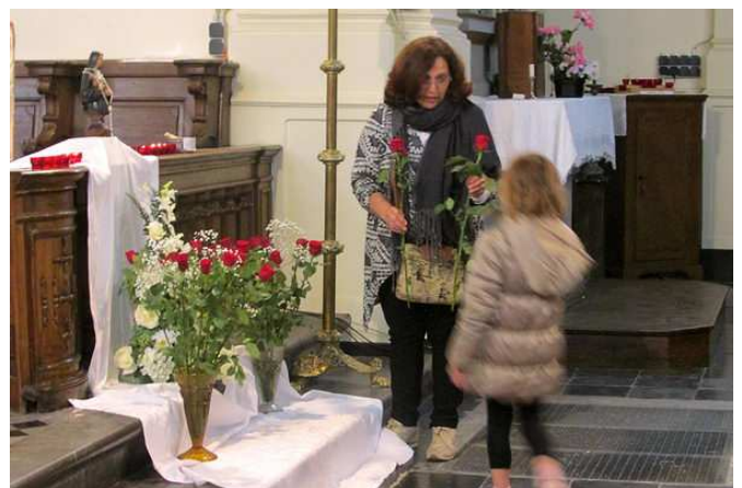
Le 13 mai à Les Waleffes, nous avons fêté les mamans et Ste Rita.