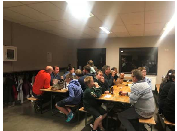
Fête d'Unité des Scouts