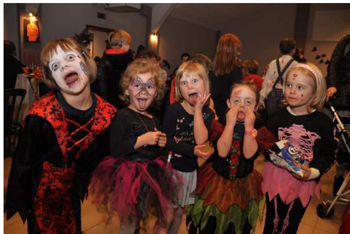
Fête d'Halloween aux écoles communales