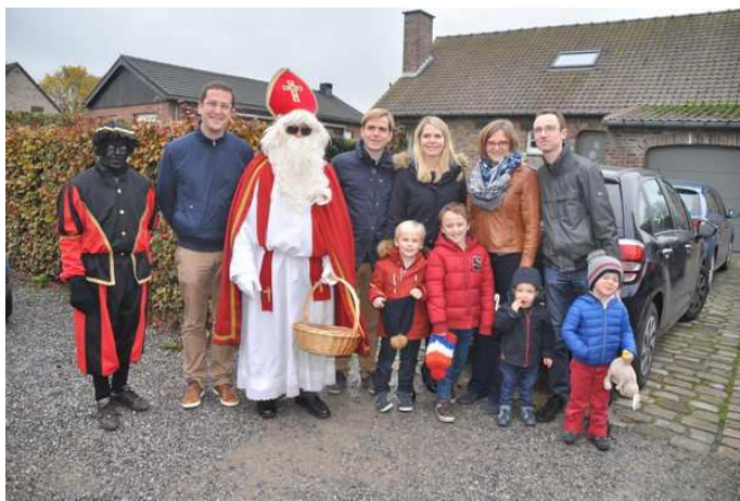
Saint Nicolas dans les rues de Viemme