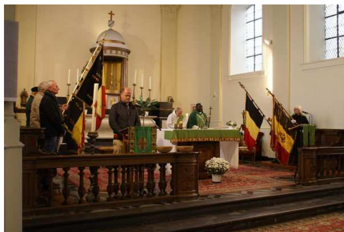
Commémoration de l'Armistice à Faimés

D'autres photos disponibles sur le site faimonsnous.be