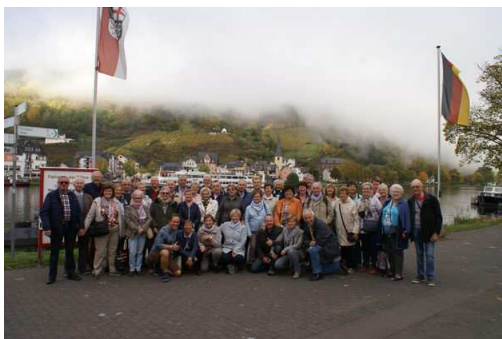
Magnifique voyage des Faimois en Moselle allemande avec une super ambiance