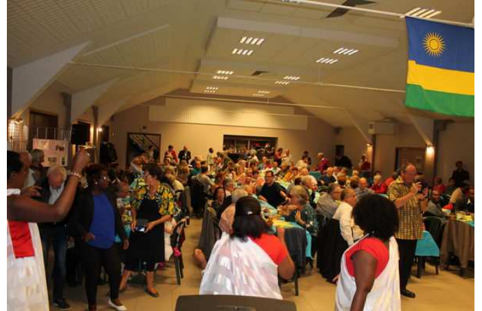
Soirée rwandaise au profit de l'asbl Centre Rugamba Kigali