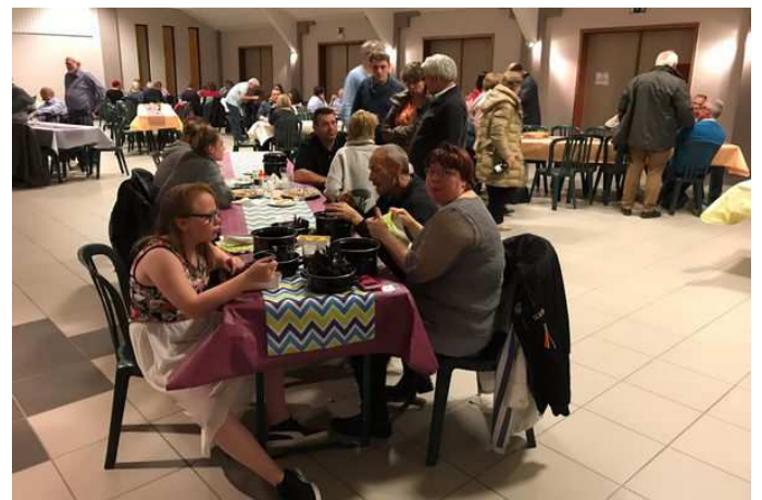
Souper aux moules organisé par le comité de Jumelage Faimés-Ambierle

D'autres photos disponibles sur le site faimonsnous.be