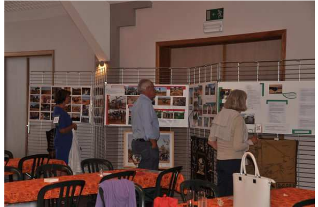
Journée couleurs d'Afrique organisée par l'asbl D'une main à l'Autre