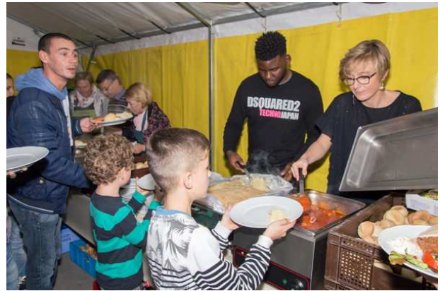
Souper et soirée de l'Etoile de