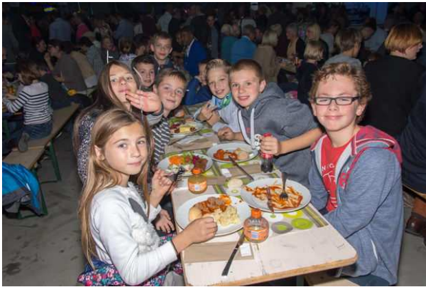
et soirée de l'Etoile de Faimés