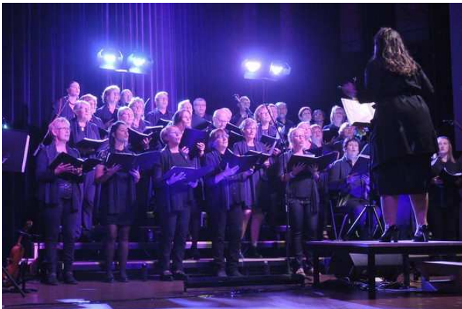
Chorale «À Quelques notes près»