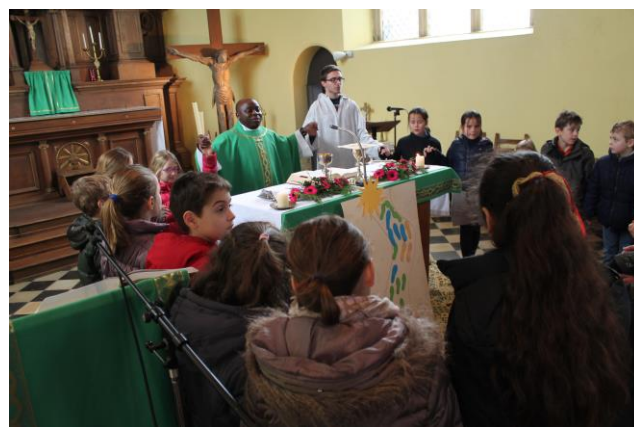
Messe des familles à Viemme

D'autres photos disponibles sur le site faimonsnous.be