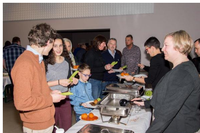
Souper à l'Etoile de Faimés