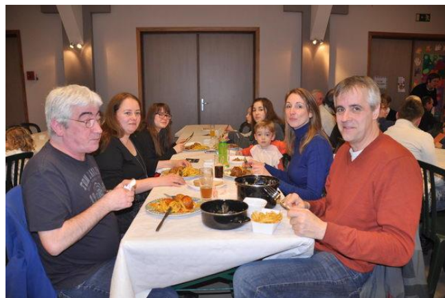
Souper aux moules organisé par le Comité du Jumelage