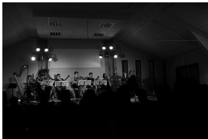
Concert : «L'aca fait son cinéma»

D'autres photos disponibles sur le site faimonsnous.be