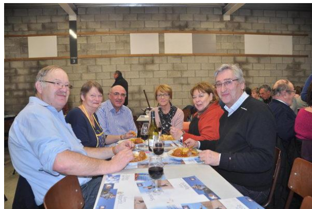
Souper paroissial de Viemmes