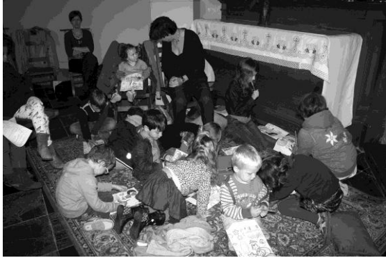
Moment créatif pour les petits bouts de l'école de Viemme lors de la messe de rentrée