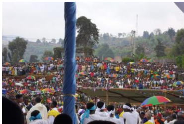
Messe d'un jubilé paroissial

Depuis une vingtaine d'années, le diocèse établit un plan pastoral triennal, comprenant un thème global qui synthétise trois modules, un pour chaque année, dans une progression qui ouvre à des perspectives pratiques et concrètes dans le contexte réel de la vie des chrétiens. L'objectif est de promouvoir une évangélisation en profondeur, qui s'appuie sur une église de situation et non seulement de principes ou de définitions dogmatiques.