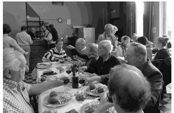
Dîner paroissial de Les Waleffes. Les boulets-frites... on ne s'en lasse pas...