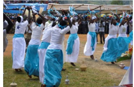
Lors d'une fête paroissiale