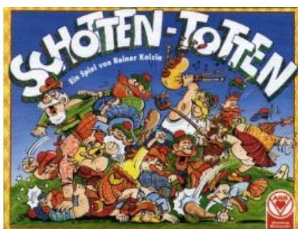
Schotten-Totten , REINER KNIZIA

Schotten-Totten est un jeu de cartes pour deux joueurs. Il s'agit d'une lutte entre deux clans écossais pour gagner le plus de bornes de pâturages à moutons possibles. Chaque joueur dispose de 6 cartes. Chacun à leur tour, les joueurs déposent une carte devant une borne de leur choix, en essayant de réaliser la combinaison la plus forte. Celui qui y parvient remporte la borne. Ce jeu est très amusant et convient aux enfants à partir de 8 ans. Le jeu de départ comporte une extension qui corse les règles et accentue les stratégies.