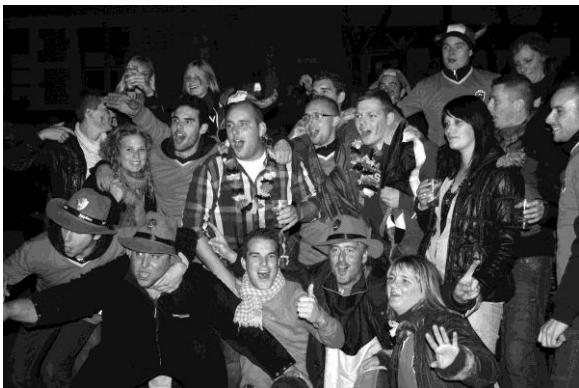
Croatie-Belgique : Don't keep calm and support the Red Devils