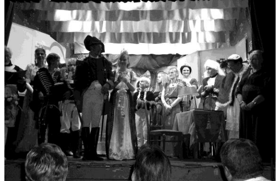
Théâtre Napoléonien. Les troupes napoléoniennes ont envahi les planches de la salle Patria