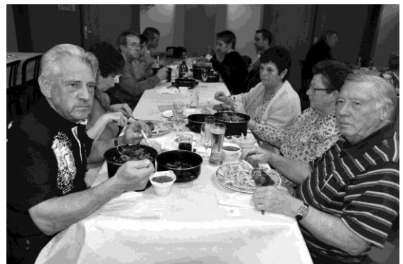
Souper moules Faim-Ambierle. A la pêche aux moules....