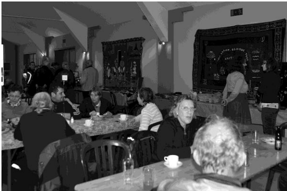
De nombreux sympathisants ont répondu présents A la journée Couleur d'Afrique