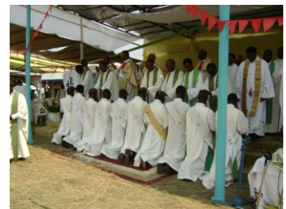
Ordination sacerdotale 2010

Malgré la décision de l'administration coloniale allemande de diviser le pays en deux du point de vue confessionnel, le nord pour les catholiques et le sud pour les protestants, - le diocèse Bururi se trouvant exactement au sud du Burundi -, le nombre de chrétiens catholiques s'élèvent à une moyenne de 30.000 par paroisse. D'après les dernières statistiques disponibles (année pastorale 2011-2012), 550.000 chrétiens sont répartis sur 18 paroisses. Ces fidèles dont la grande majorité est pratiquante sont aidés par 97 prêtres, dont 95% ont entre 28 et 55 ans et sont engagés dans la pastorale diocésaine sous ses multiples faces : les paroisses, les écoles, les projets de développement, la santé.