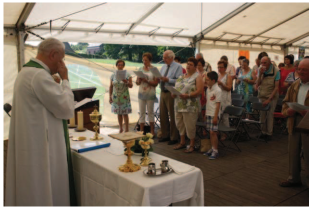
La messe en wallon : événement incontournable, très apprécié lors de la fête de la bière.