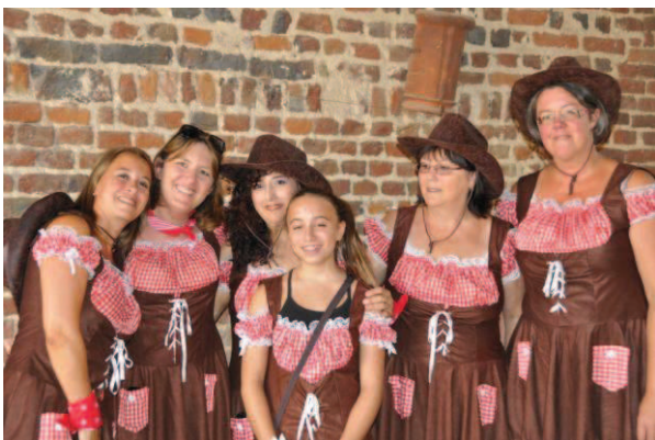
Viemme et Vous : animation western et...taureau indomptable...