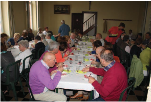
Dîner paroissial de Celles : grand moment de rencontre et très convivial.