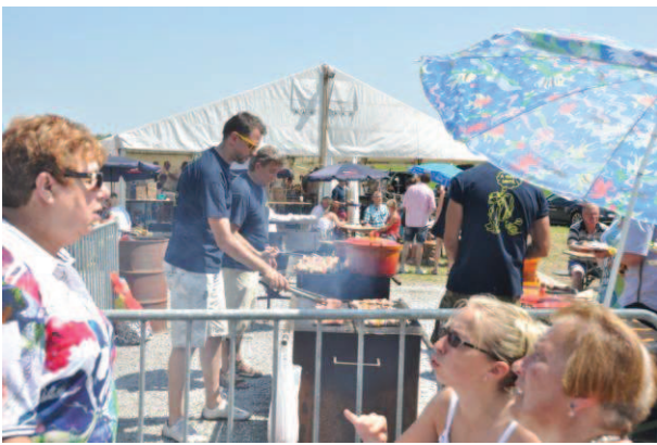
BBQ à Celles : bonne ambiance avec la complicité du soleil.