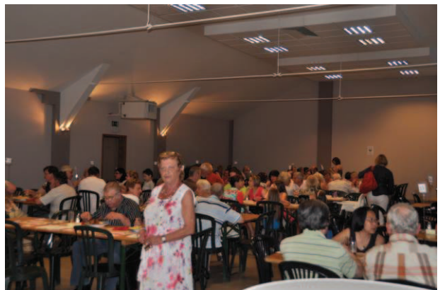
D'Une main à l'Autre : repas record pour une noble cause.