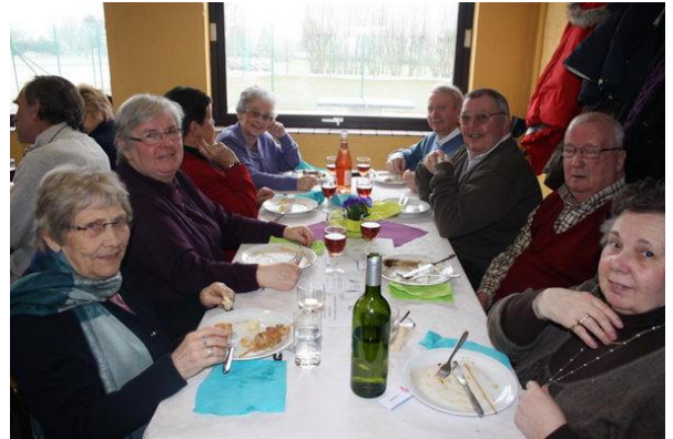
Dîner du cercle horticole