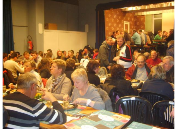
Balade gourmande à Les Waleffes