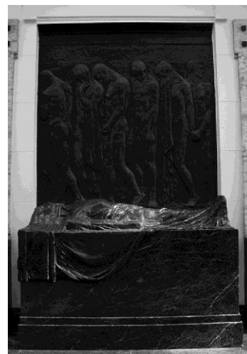
Monument aux universitaires liégeois morts pour la Patrie

En 1940, il fait partie des quatorze professeurs de l'ULB qui se virent interdire l'exercice de leur profession par les autorités allemandes. Il en profita pour aider diverses organisations de résistance en mettant à leur disposition son atelier de sculpteur pour des émissions radio en direction de l'Angleterre ou en leur apportant un soutien financier.