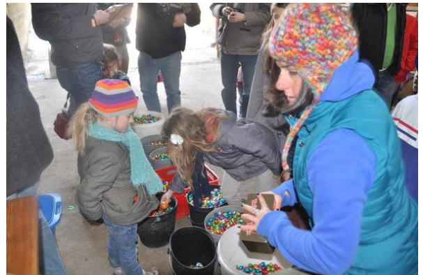
Chasse aux oeufs

Autres photos disponibles sur le site www.faimonsnous.be