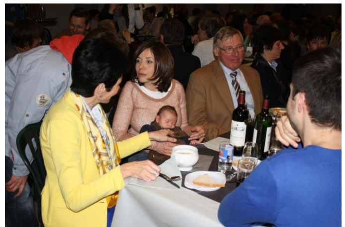
Souper de la Bourgmestre

Autres photos disponibles sur le site www.faimonsnous.be