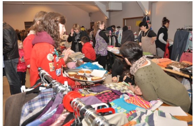
1 ère bourse exclusivement réservée aux vêtements à Faimés