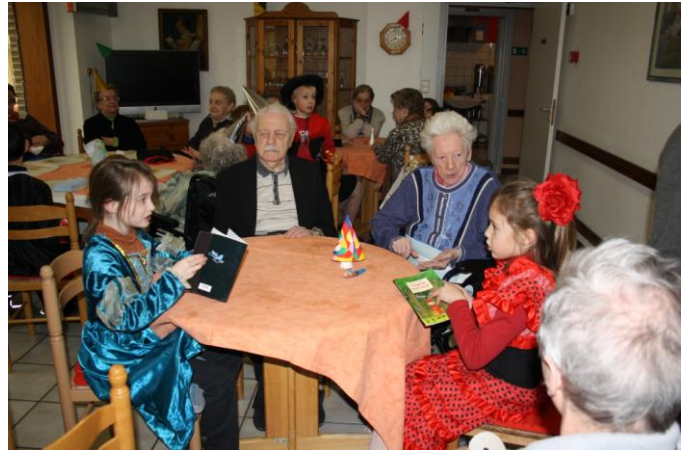
Symbiose entre jeunes et plus âgées lors d'une activité intergénérationnelle