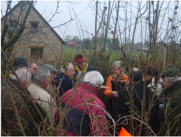
Démonstration de taille organisée par le Cercle Horticole de Faimés