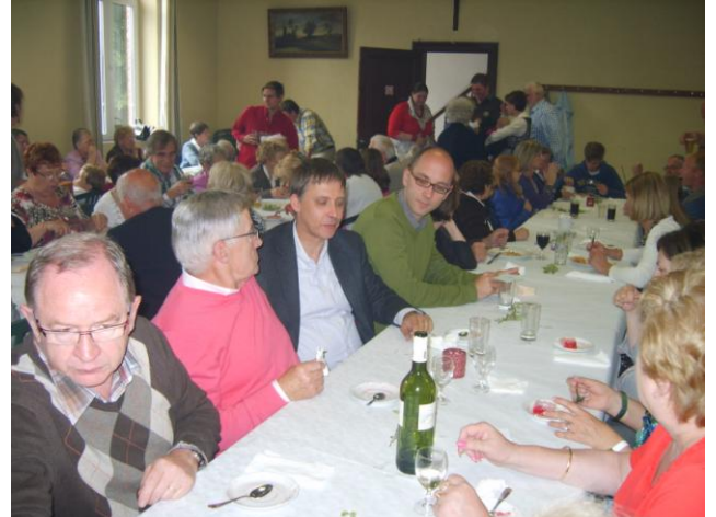
Dîner paroissial à Celles, on y mange de bon appétit!