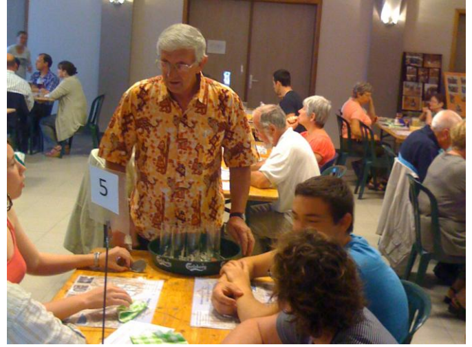
Des conversations à bâtons rompus.