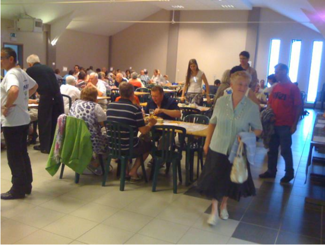
Un bon repas...