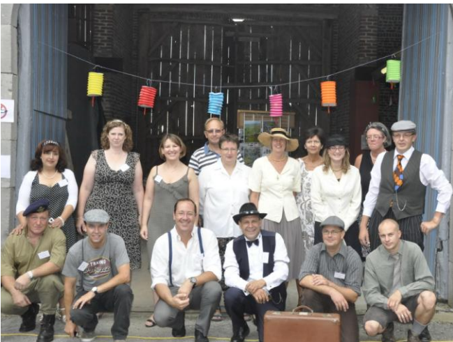
Cette année le comité de Viemme et Vous avait trouvé pour thème les années 40-50!!