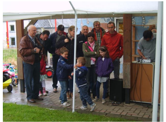
Fancy fair à la petite école de Viemme, les élèves participent au spectacle et les parents iront se désaltérer.