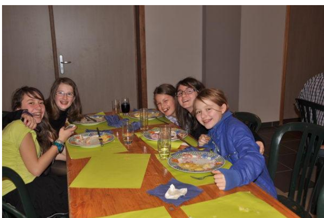
Souper raclette de l'école communale