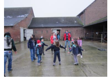
Pour le Staff Baladin, Sloughi

Le 17 mars, nous nous sommes préparés pour les jeux-olympiques de Londres. Nos aventures continuent et vous les retrouverez le mois prochain.