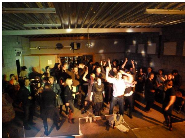
Et on danse danse danse jusqu'au bout de la nuit