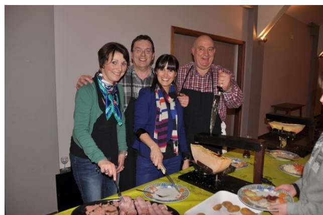
Une équipe de choc pour assurer le service