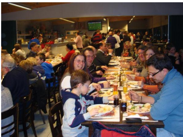
Souper tartiflette au foot