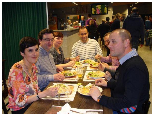
La table du président