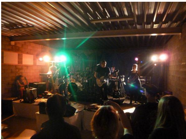
Soirée années 80 de la petite école de Viemme