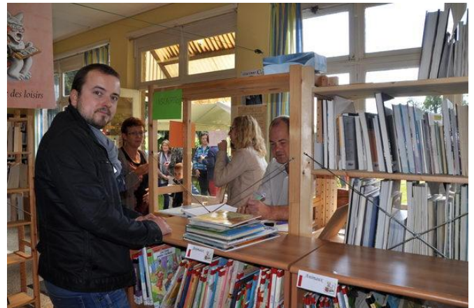
Apéro à la bibliothèque de Viemme