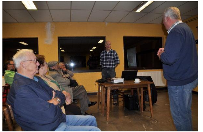
Assemblée générale au Cercle horticole