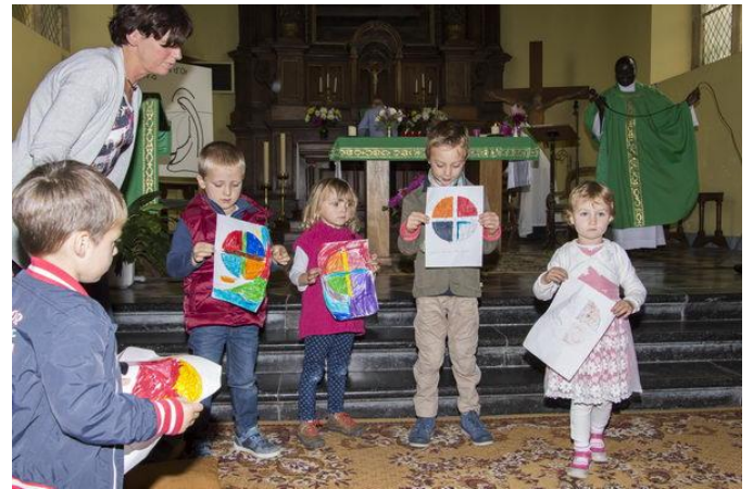
Messe de rentrée à Viemme avec la participation des «Petits bouts» de la petite école de Viemme