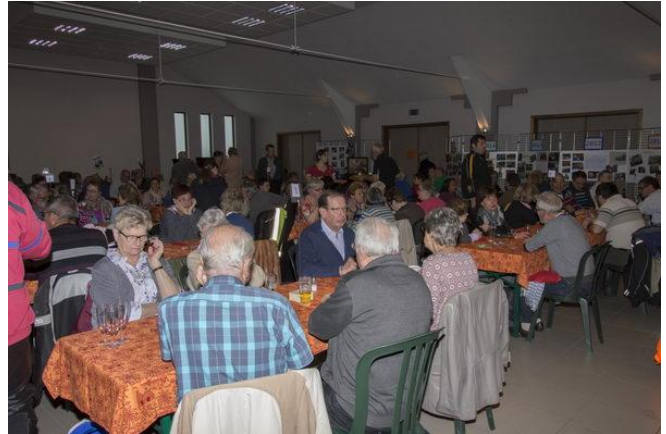
Journée Couleurs d'Afrique organisée par l'asbl D'une main à l'Autre