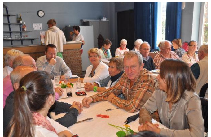
Dîner paroissial à Les Waleffes

Autres photos disponibles sur le site faimonsnous.be