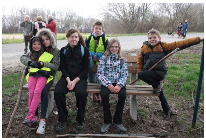
Marche de Borlez vers la Sarthe

Autres photos disponibles sur le site www.faimonsnous.be