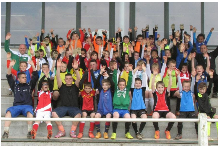
Stage de foot à l'Etoile de Faimés