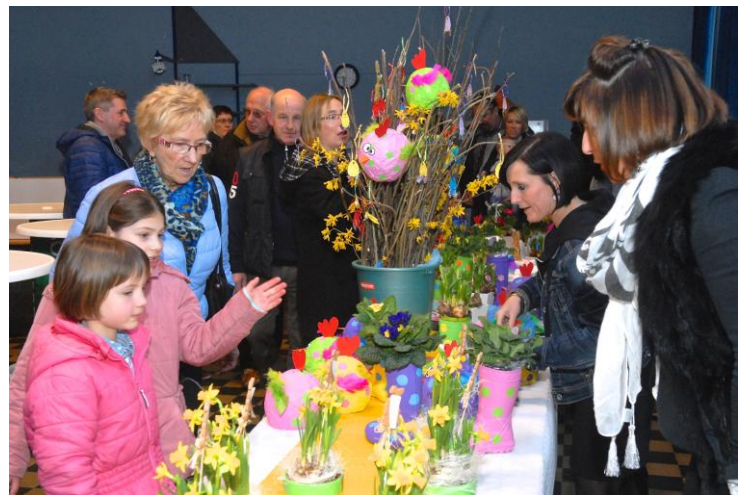
Marché de Pâques à l'école de Les Waleffes

Autres photos disponibles sur le site www.faimonsnous.be