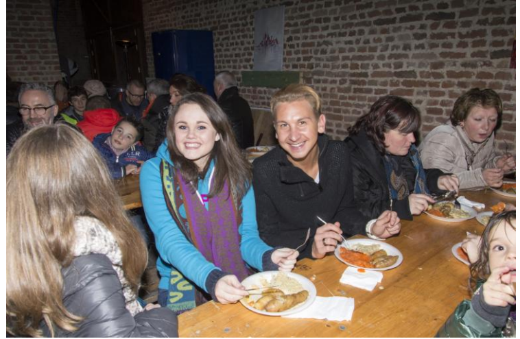
Balade gourmande des primevères à Les Waleffes