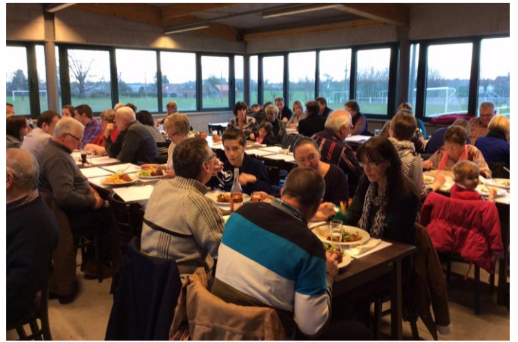
Souper des Djoyeux Borlatis