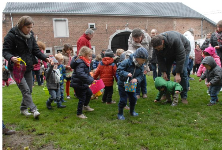
Chasse aux œufs organisée par les Djoyeux Borlattis à Borlez