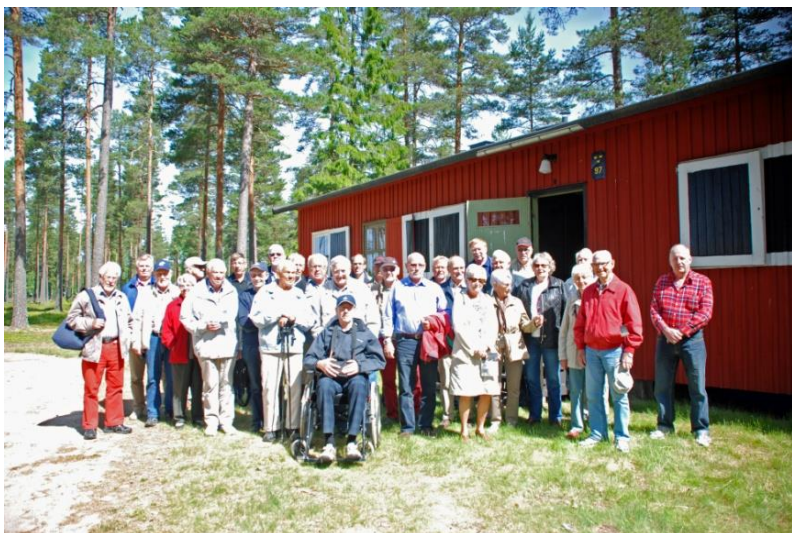
Vi som var där samlade utanför baracken med ordersalen.

Därefter följde en genomgång av basen och bakgrunden till att den byggdes. Efter en kort rundvandring bland gamla byggnader och närförsvaret var det så dags för lunch bestående av ärtsoppa med pannkakor och sylt. Efter lunchen framförde föreningen sitt tack till de medverkande från fältet och överlämnade en gåva bestående av den Rörstrandstavla som delades ut i samband med nedläggningen.