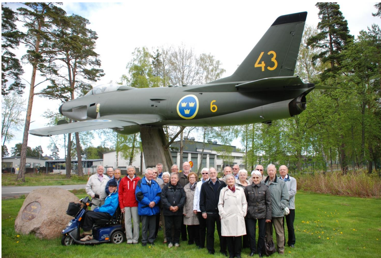
2014 års årsmötesdeltagare

Årsmötesprotokollet framgår av följande sida.