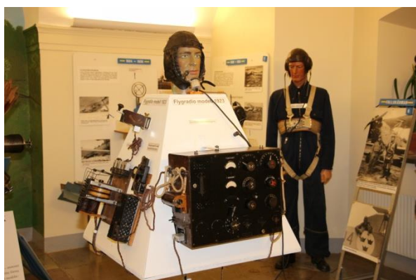
Radioutrustning från anno dazumal