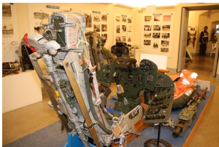
Förarplats A 32

Omslagsbilden visar en översikt av F 6 flottilmuseum som behandlar flottiljens historia åren 1939 till 1994. På en mycket begränsad yta har en tilltalande utställning åstadkommit som har fått beröm av många besökare. Apropå besökare; fästningsmuseet besöktes av fler än 34000 besökare under 2017 varför man kan anta att samma siffra gäller även för flygdelen. Det torde inte vara många flottilmuseer som kan uppvisa detta resultat.