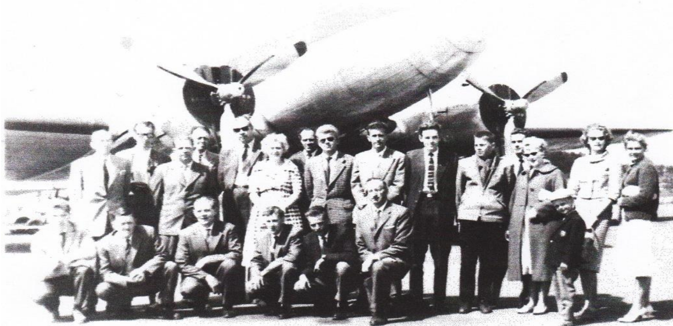
Namnlistan F 6 avd 6 1960