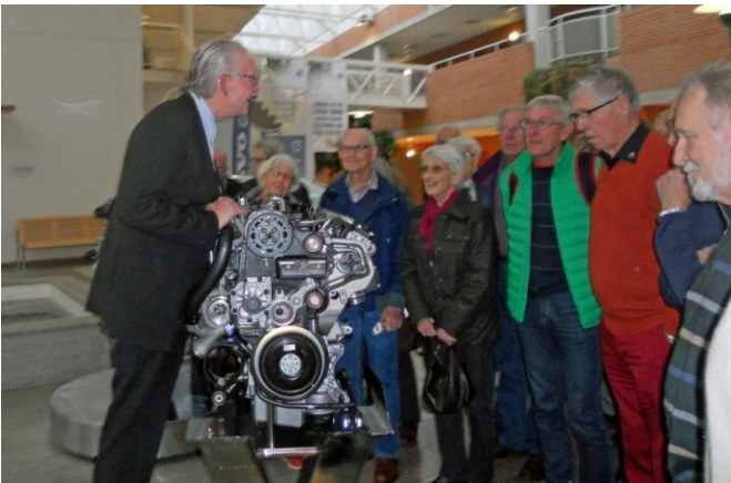
Vår guide framför en av de senaste Volvomotorerna. En vacker pjäs!

Det rådde, av förklarliga skäl fotoförbud i fabriken men i entrén såg det ut så här.