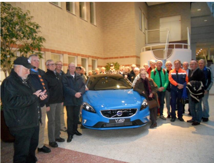
Och så här nöjda var vi efter besöket. Kamrater och guider från Volvo.