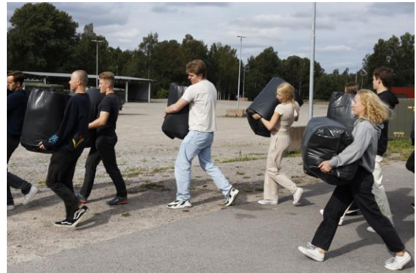
Inrvckning. mycket areier är det.

arrangemang. Glädjande nog var listan över vad man bör fortsätta med avsevärt längre än vad som behöver rättas till.