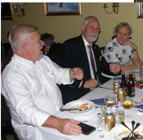
Per i berättartagen