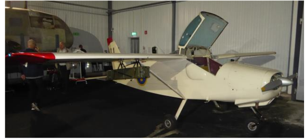
Kronmärkt MF19, inte så vanlig

Att få bra bilder där var inte lätt, dels trångt och dels dåligt ljus, men några blev det.