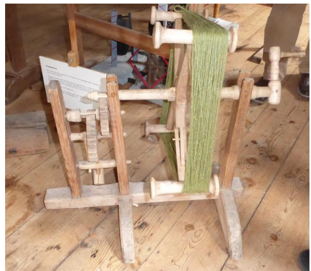
Knäpphärveln, idén till allt

Per har sedan utvecklat detta till en stor konst,