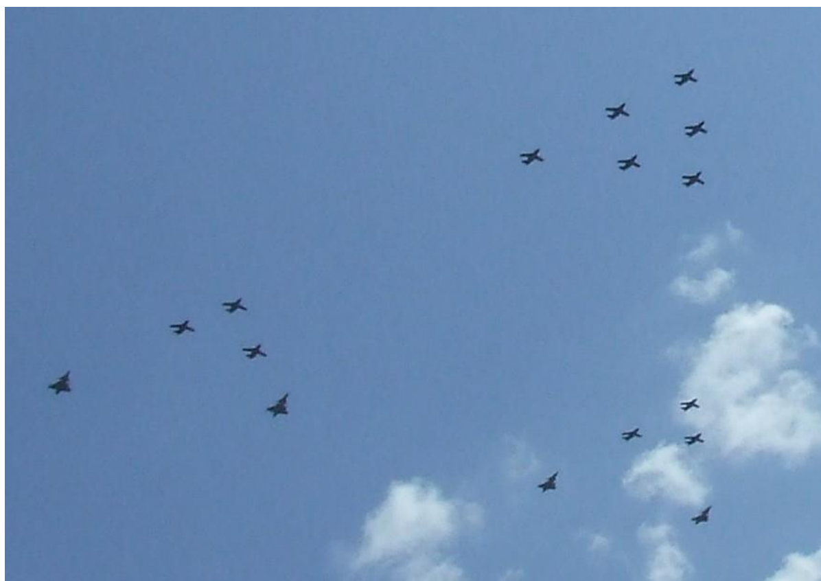
Påpassligt nog hade S-O Carlsson placerat sig vid Ljungstedtska skolan i Linköping för att förevisa överflygningen. Han lyckades få med alla 12 Sk60 och 4 Gripen på samma bild

/Text via Aftonbladet och FM. Red av Sture Axelsson