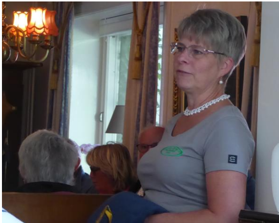
Camilla talar engagerat för sina produkter

Mätta och belåtna efter lunchen och kringströvande på Torpön, nu sken solen, är det dags för nästa etapp till Brostorps Gård.