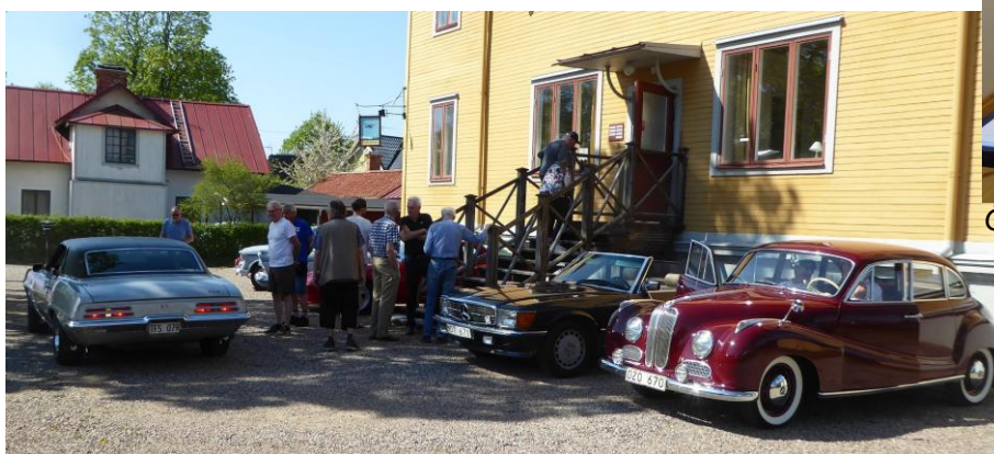
Veteranbilar på besök