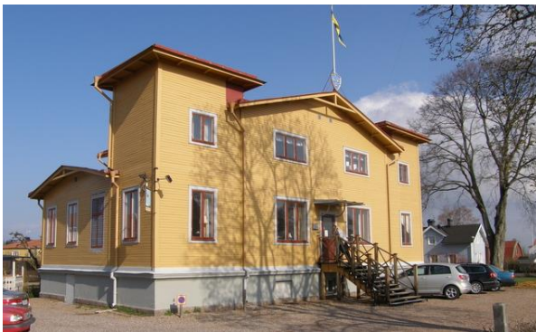
I detta fantastiska Flygets Hus håller vi till.