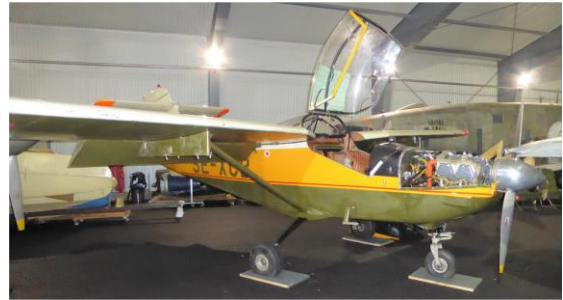
En lite avklädd MFI 15 Safari