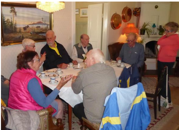
Det gick åt mycket god ostkaka, sylt och grädde

Personligen fastnade jag för Brostorps "Kolomi", en mycket god grillost.