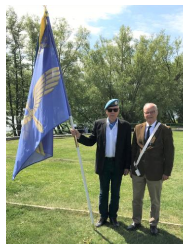
HB fick också hålla i fanan.