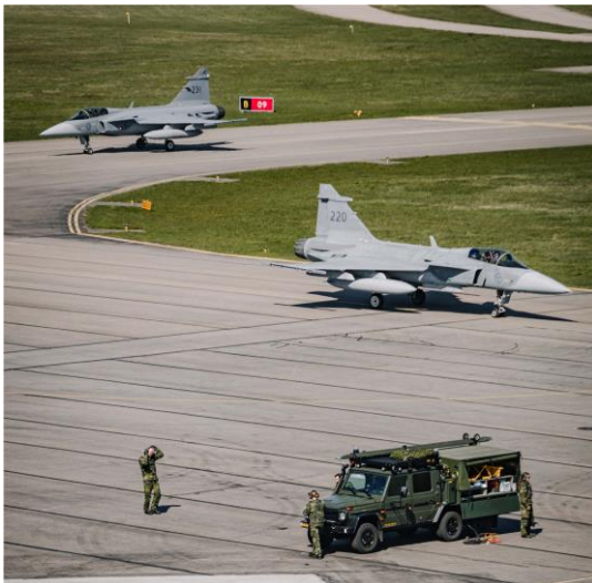
Gripen på Kungsängen, Norrköping