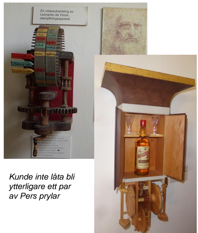
Kunde inte låta bli ytterligare ett par av Pers pryglar