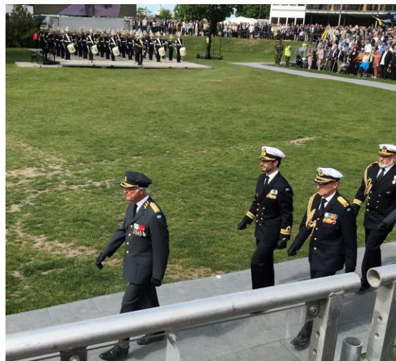
Kung och prins

Vid ceremonin delade H.M. Konung Carl XVI Gustaf, i närvaro av H.K.H. Prins Carl Philip med flera, ut Försvarsmaktens förtjänstmedaljer till förtjänsta medaljörer. En av medaljörerna var Kn