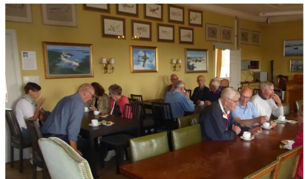
Fika med eftersnack