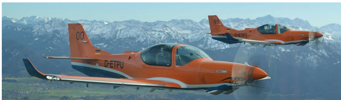
På tal om överflygning, nu har vi sett Sk40 i luften över Linköping, kronmärkta