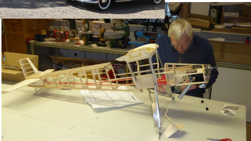
Modellbygge visas i praktiken