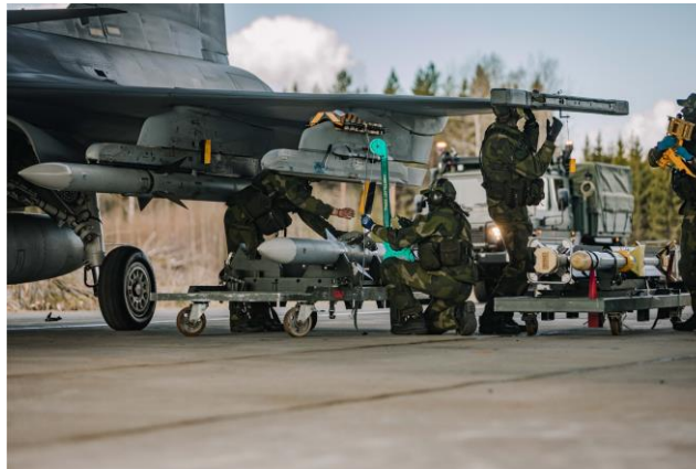
Klargöring på Skavsta, Nyköping