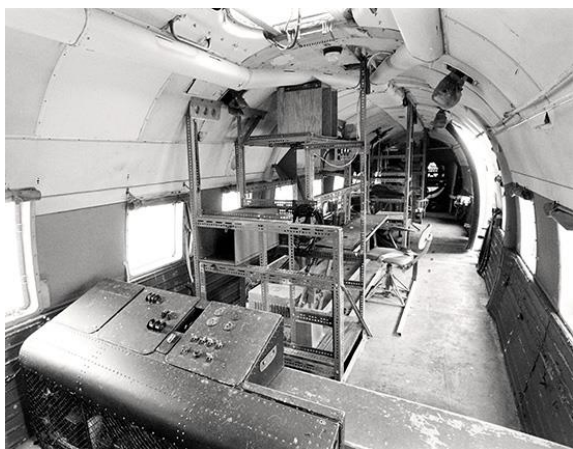
I den stora kabinen fanns stativ för signalspaningsutrustningen med tillhörande operatörsplatser. Bilden är tagen bakåt i kabinen.

Det obeväpnade flygplanet fick beteckningen TP 82 i svenska flygvapnet och användes främst för signalspaning. Men det sattes också in som transportflygplan för Röda Korset och FN, på grund av dess stora lastkapacitet. Flygplanet deltog i flera hjälpaktioner, exempelvis vid jordbävningkatastroferna i Agadir och Skopje i början av 1960-talet. Det utförde också transporter för de nordiska FN-enheterna i Kongo och Gaza. Flygvapenmuseum TP 82 var flygvapnets enda Vickers Varsity och levererades till flygflottiljen F 8 Barkarby i januari 1953. Som signalspaningsflygplan försågs TP 82 med stora mängder avancerad elektronisk utrustning. Verksamheten hade högsta sekretess och flygplanet kallades allmänt för spionplanet.