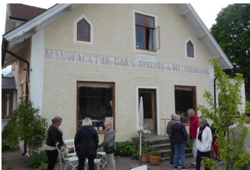
Den gamla affären