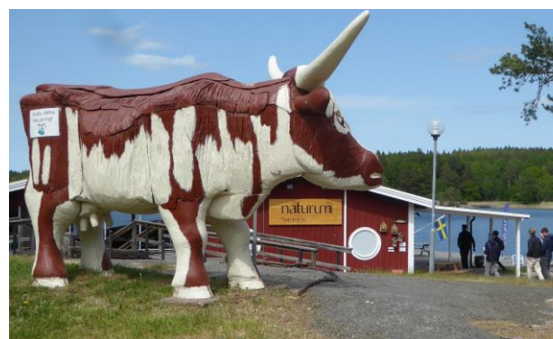
Naturum och Sommakoa