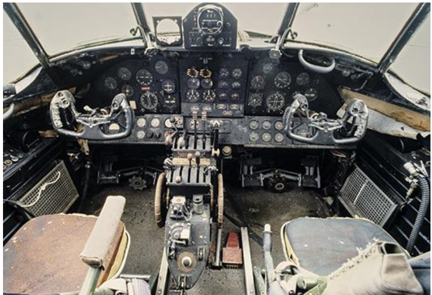
TP 82 flögs normalt av en pilot, assisterad av färdmekaniker och navigatör. Autopilot fanns ej men fmek blev duktiga på att hjälpa till att flyga på angiven kurs och höjd.