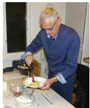
HB höll reda på kvällens hockey, fotboll och handboll via olika media. Fick till sist lite pannkaka i köket.