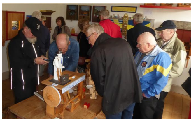
Innamätet i Frank Sinatra studeras ingående.