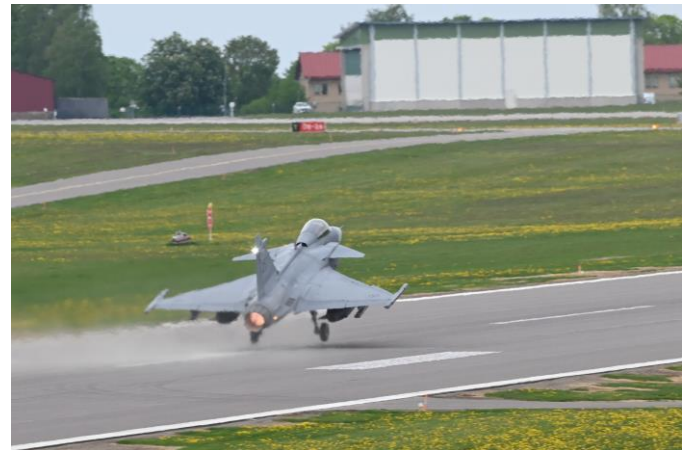
Gripas som startar från Malmen är inte ovanligt men under Aurora 23 kommer de från en stridsflygdivision som ombaserat.

I luften kommer vi bland annat att få se dagens JAS 39 Gripen C/D och morgondagens JAS 39 Gripen E. Tp84 Hercules, helikopter 15 och 16, skolflygplanen SK60 och nya SK40, Hawk och NH90 från Finska Flygvapnet, historiska flygplan