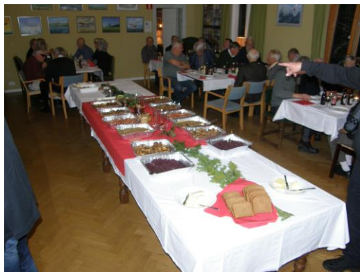
Julbordets läckerheter serverade