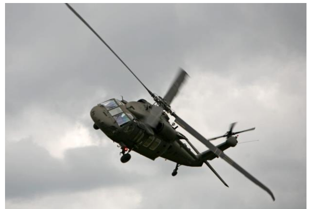
Hkp 16

Ytterligare flygplan kommer att läggas till i programmet vartefter de blir klara. Ett detaljerat program och i vilken ordning de olika deltagarna flyger kommer under sommaren.