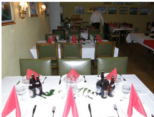
Dukat och klart