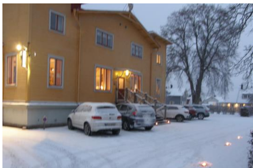
Flygets Hus i vinterskrud välkomnar

Den 9 december var det då äntligen dags för Lillejul i Flygets Hus. Tre år sen sist på grund av den envisa Covidpandemin.