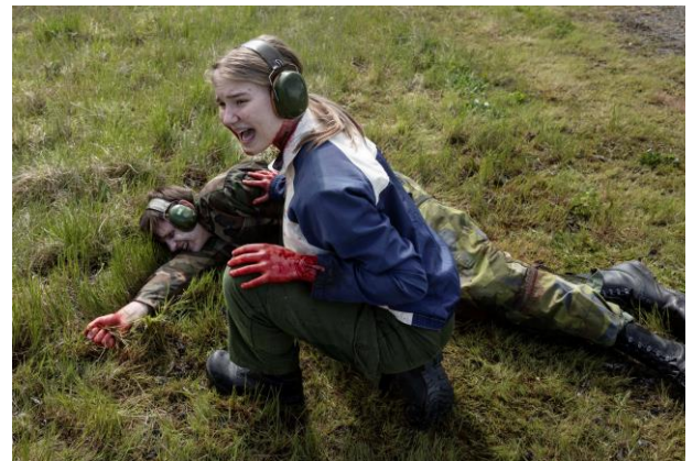
Civilsamhället testas under Aurora, till exempel när ett stort antal civila också skadas under ett fientligt anfall.

3:e Flygflottiljen utsågs till basprioriterad under Aurora 23 vilket förutom Malmen och Bråvalla innebär två civila flygplatser, Kungsängen i Norrköping och Skavsta i Nyköping. Civila flygplatser används allt mer under luftförsvarsövningar de senaste åren. Det innebär också mer jobb för Hemvärnet som är med och skyddar och bevakar de olika baserna.