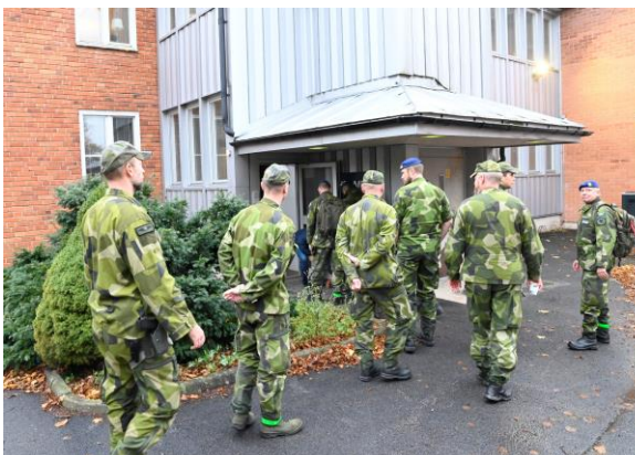
Ater fylls Bråvalla av flygvapenpersonal, nu från tredje flygflottiljen.

Den här gången lämnar också staben Malmen för att omgruppera på Bråvalla där Försvarsmakten har kvar ungefär halva ytan som en gång var en flygflottilj. Helikoptrar kan fortfarande använda Bråvalla men det kommer inte att flygas därifrån under Aurora. Basenheten, som är vana vid att gruppera i terräng följde med och lämnade ett ledningslag för att hålla Malmen öppen för flygande enheter som i normala fall inte landar där.