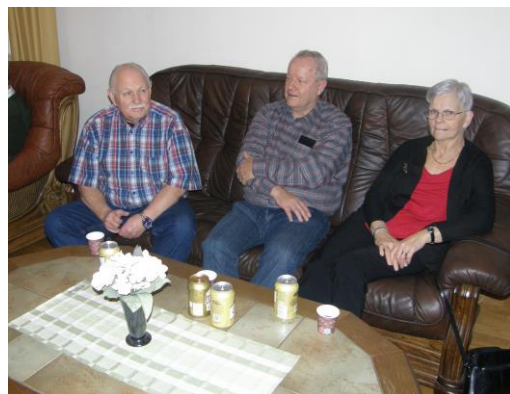
Lite glögg och en öl före maten sitter bra.

Gästerna börjar så sakta anlända, betala sin mat och ev dryck med Swish. Även den äldre generationen börjar vänja sig vid nymodigheterna, även om många fortfarande föredrar riktiga pengar.