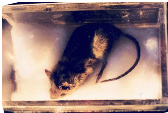
Kaffemusén på lit de parade

I berörda rum rev man bort samtliga golvlister samt bänkhurtsen i lunchrummet. Firman "Vått och Torrt" fick rycka ut och sätta igång sina torrluftsläktar som fick stå och gå ca 3 veckor. Vi som satt i detta elände var väl "torrisar" förut och inte blev det bättre av detta, även om det var bra för golv och väggar. Men i julveckan fick vi iordning igen och allt blev som förr.