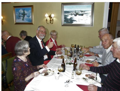
Tummen upp från Oscar måste betyda att maten är OK.

Och så var årets Lillejul till ända. Återstår att duka av, packa ihop och återställa Flygets Hus.