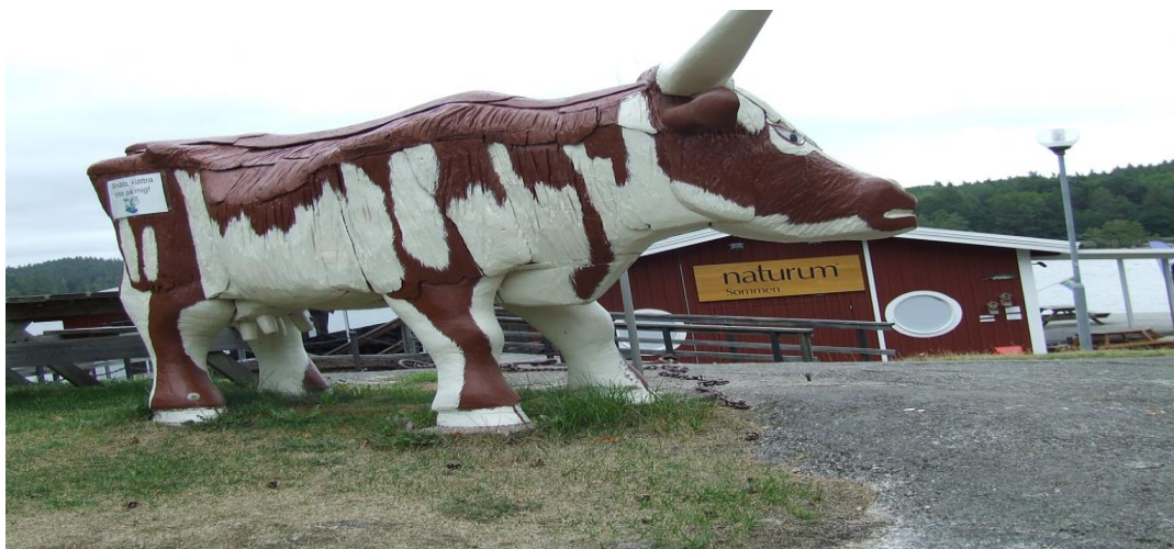
Sommakoa på Torpön

Ovanstående kan tjäna som en påminnelse om årets sommarresa där vi kan hälsa på Sommakoa.