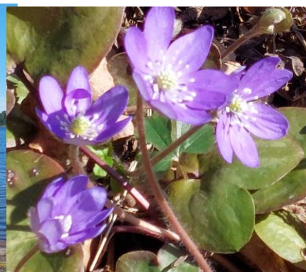
Blåsippan ute i backarna stå....