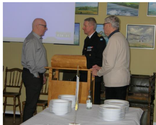
Eftersnack med översten.