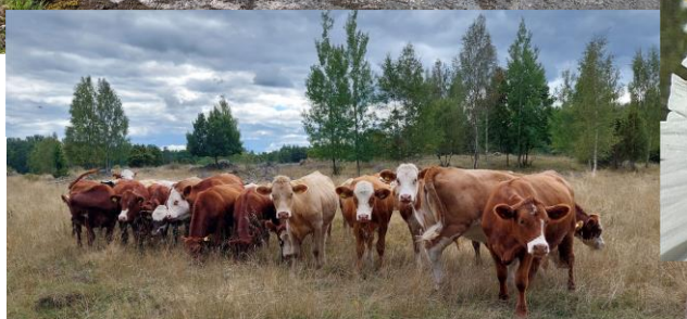
Vandring bland ungdjur på Östgötaleden