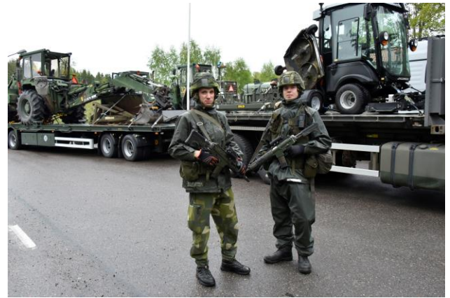
Tredje flygflottiljen ska kunna betjäna tre baser samtidigt samt ansvara för en fjärde där ett an-nat flygförband huserar.