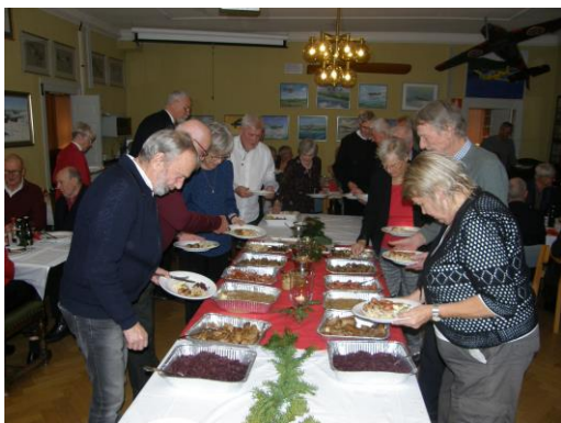
Nu har det blivit ordning i leden. Skam annars med så många gamla militärer....

Trots nummerade bord och lottdragning om turordningen blev det (som vanligt) halvt kaos innan alla fått plocka till sig mat. Allt ordnade upp sig och alla lät sig väl smaka.