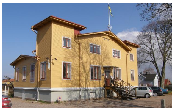
I detta fantastiska Flygets Hus håller vi till.

Du som har förslag på lämpliga mål för utflykter och studiebesök, hör av er till någon i styrelsen. Samma sak om du har förslag på föredragshål- lare.