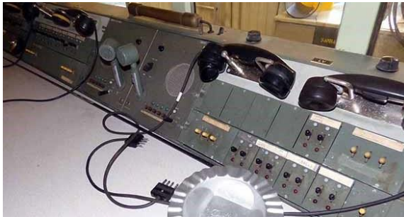
Några av de 5 exp platserna

I Kpl-bilen finns fem expeditionsplatser vilka besätts av trafikledare (TL), biträdande trafikledare (BITR), vakthavande officer (VO), luftvärnsofficer (LV) och kartritare (KRIT).