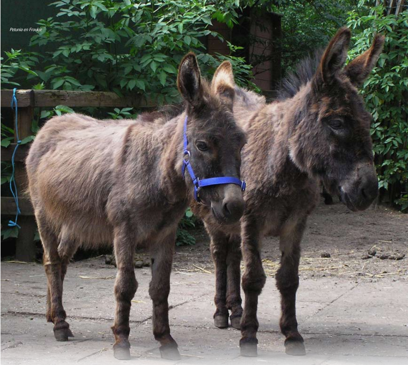
Petunia en Froukje