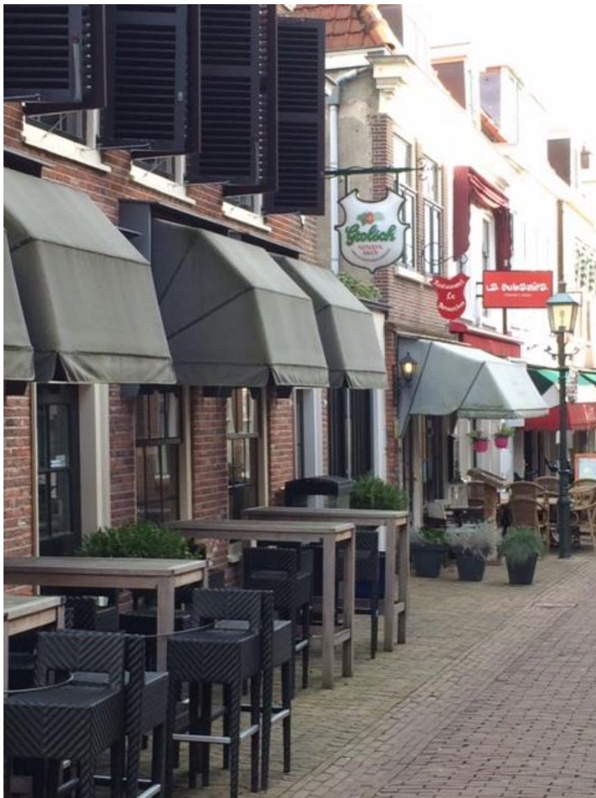
Terrassen in het Huygenskwartier in Oud-Voorburg.

We reflecteren op de bereikte resultaten en effecten in relatie tot de doelstellingen van de pilot en door de deelnemers geformuleerde ambities. Hiermee richten we ons op verankering van de resultaten en geleerde lessen in en buiten de pilotgemeenten, met aanbevelingen voor (lokale) vervolg(keuzes). In deze eindpublicatie adresseren we ook de landelijke aandachtspunten die tijdens de pilot zijn gebleken. We besteden in deze eindpublicatie achtereenvolgens aandacht aan de doelen en aanpak van de pilot (hoofdstuk 2), initiatieven en verlichte regels (hoofdstuk 3), aanbevelingen (hoofdstuk 4) en de ambities (hoofdstuk 5).