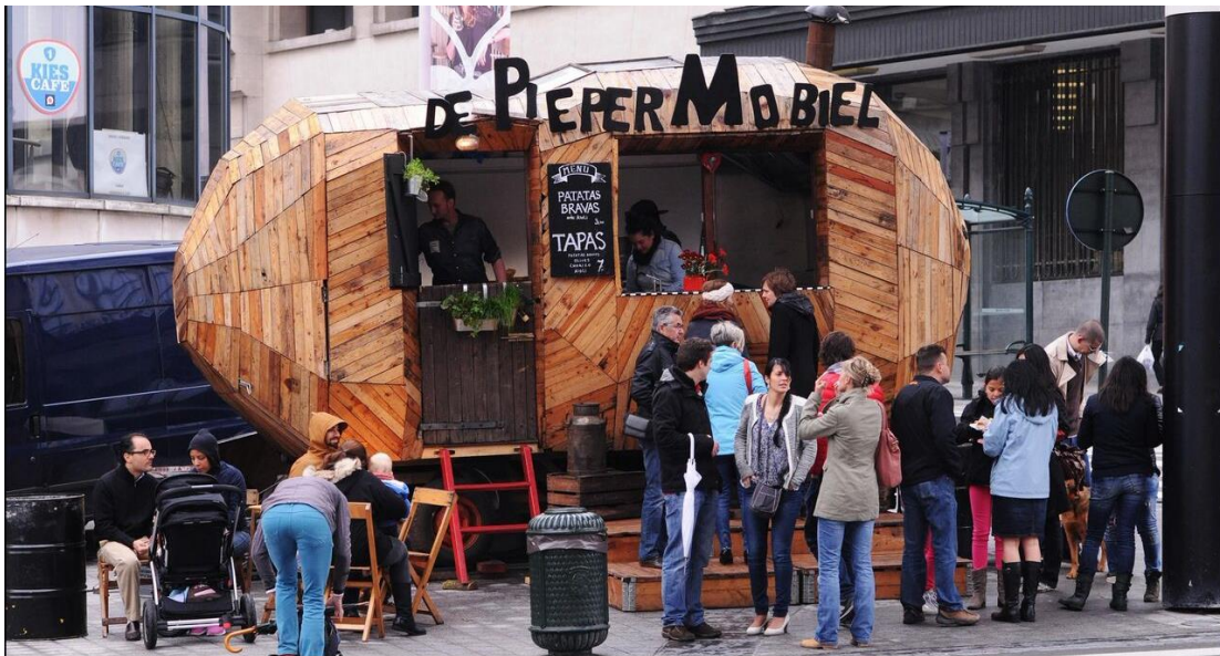
“De Piepermobiel”, één van de initiatieven in Ede.

Met meer kennis, bereidheid tot experiment en/of ruimere interpretatie en toepassing van regels, blijkt er (veel) meer ruimte in regels te zijn dan wordt verondersteld. Een pilot- of experimentaanpak die verlichting van regeldruk nastreeft heeft de belofte om tot verbeterde lokale-publiek private samenwerking te komen. En te ontdekken op welke wijze anders met de regels kan worden omgegaan of welke aanpassingen in regelgeving zinvol zijn om ruimte voor ondernemerschap te creëren.