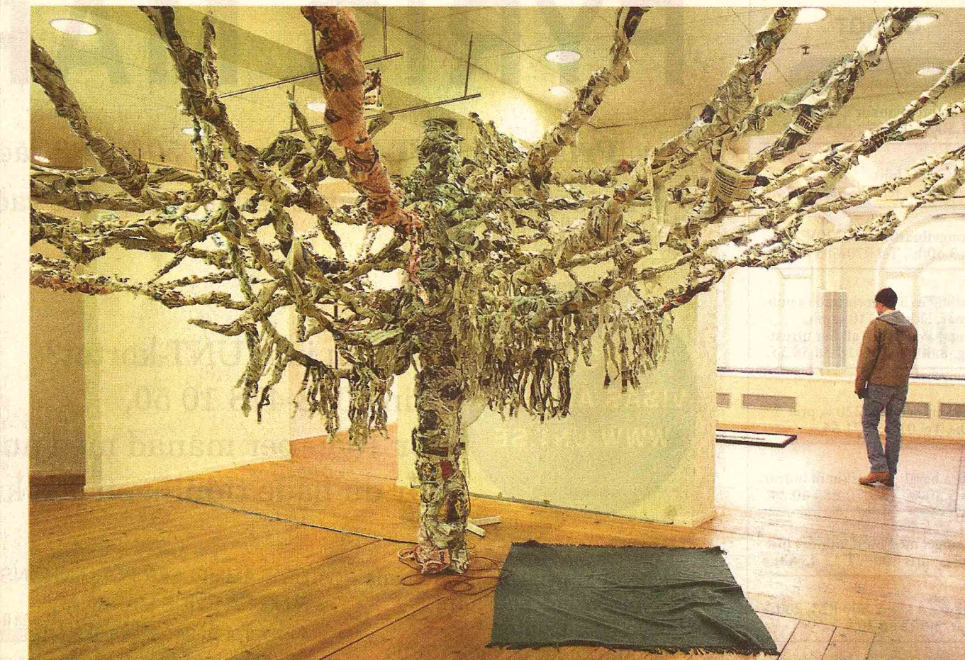
Det sjungande trädet 2003, installation av Eva Högberg.

Utställningen har ett aktualitetsvärde som kanske blir