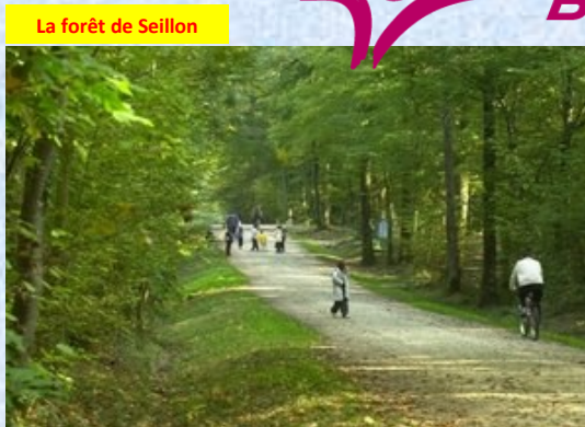
La forêt de Seillon