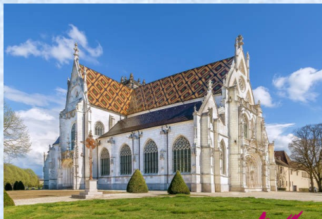
Monastère Royal de Brou

Es bietet eine außergewöhnliche Natur, ein Kulturerbe, eine Gastronomie und einen Reichtum an Tourismus, den Sie während Ihrer Teilnahme an diesem unumgänglichen jährlichen Ereignis entdecken können.