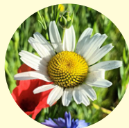
Blommor i vissa ängsfröblandningar blommar redan första året.