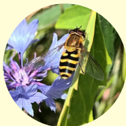
Blomfluga vid Gröna Hägerns odlings-lottsområde.

Låt bli att klippa gräsmattan Ett alternativ är att låta bli att klippa gräsmattan och se vilka lokala blommor som kommer upp. I en hårdklippt gräsmatta trivs i stort sett inga arter, minimera därför helst sådana ytor.