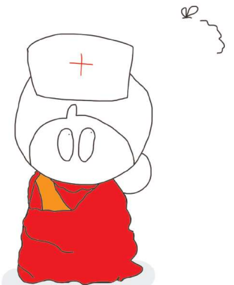
Tegning af og med tilladelse af: Nurserruth

Hvis du tror, du er for lille til at gøre en forskel, så prøv at sove med en myg. - Dalai Lama