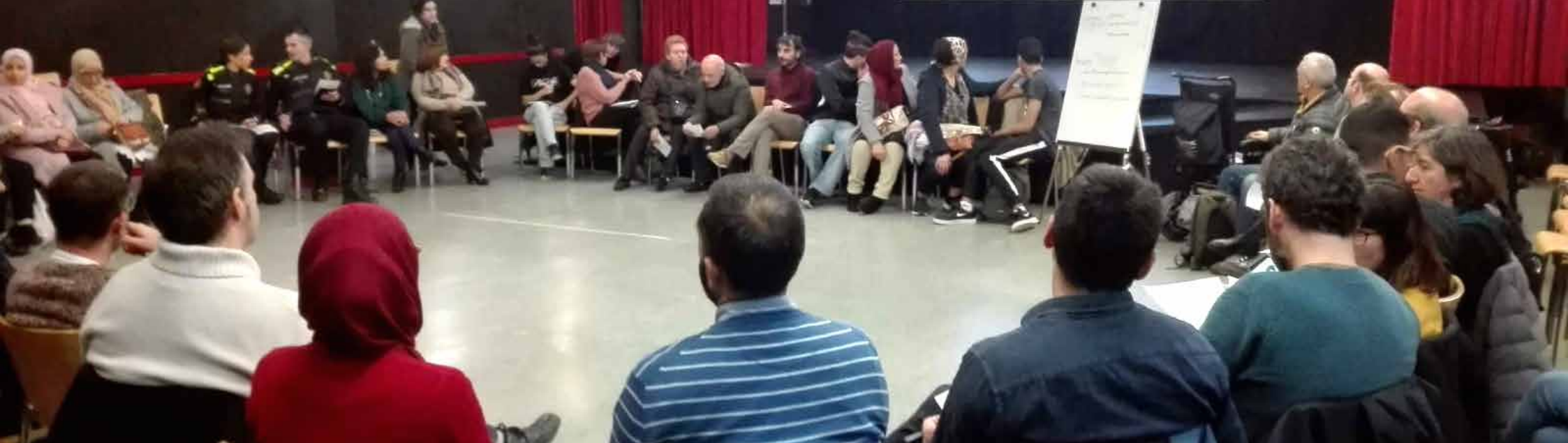
Foto d'Arxiu del Grup de Treball de Seguretat Humana i Construcció Comunitària, 2020. Taller comunitari. Seguretat Comunitària des de la cura del barri. Trinitat Vella, Barcelona

Aquest article pretén reflexionar al voltant de les possibilitats i limitacions d'un concepte alternatiu de seguretat que situa les necessitats de les persones com a centre focal de la seva atenció i cura. Des d'aquesta mirada, la noció de seguretat no s'orienta tant en la concepció tradicional centrada en la protecció de l'Estat, sinó cap a una concepció que promou la protecció de les persones sota la lògica del desenvolupament humà, el dret a la ciutat i la construcció comunitària. És per això que l'itinerari que es proposa per aquest article s'inicia presentant el concepte de seguretat humana; es continua analitzant tant les potencialitats que ofereix en clau de benestar de les persones, les llibertats i els drets humans, com les debilitats a nivell de clarificació conceptual, com de distorsió en el seu ús i aplicació en polítiques públiques; i, finalment, es defensa la necessitat d'apostar per la noció de seguretat humana com a marc per a la promoció de condicions materials i socials mínimes per una existència digna a la ciutat des d'una perspectiva de construcció comunitària de la seguretat.