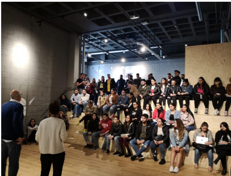
Presentació del projecte Coneix la Màquina

Tot just fa un any de l'obertura de l' espai cultural la Màquina, un centre destinat a convertir-se en un espai obert als barris a on el teixit associatiu pugui desenvolupar-hi tasques per a la comunitat de forma gratuïta. En aquest espai polivalent és a on el 15 d'abril vam oferir la presentació del projecte Coneix la Màquina amb l'assistència de més de 60 persones .