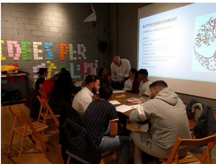
Sessió d'autoconeixement amb el jovent.

En aquesta direcció la Formació s'ha basat en fomentar l' apoderament i l'acompanyament per a la selecció laboral a 40 joves que actualment estan en situació de desocupació i que compten amb la titulació de la ESO. S'han realitzat sessions formatives a on s'ha potenciat la co-responsabilitat dels joves en el camí de la recerca de feina. Des d'una mirada apreciativa , s'ha generat l'espai des d'on poder treballar l' autoconeixement , la capacitat reflexiva al voltant de les fortaleces i la definició dels reptes de futur en l'àmbit laboral.