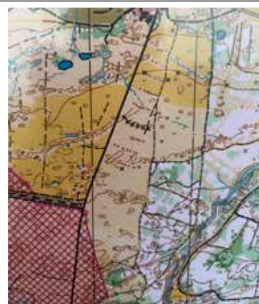
Kartprov från Raghammer, etapp 2 vid Bornholm Høst Open.