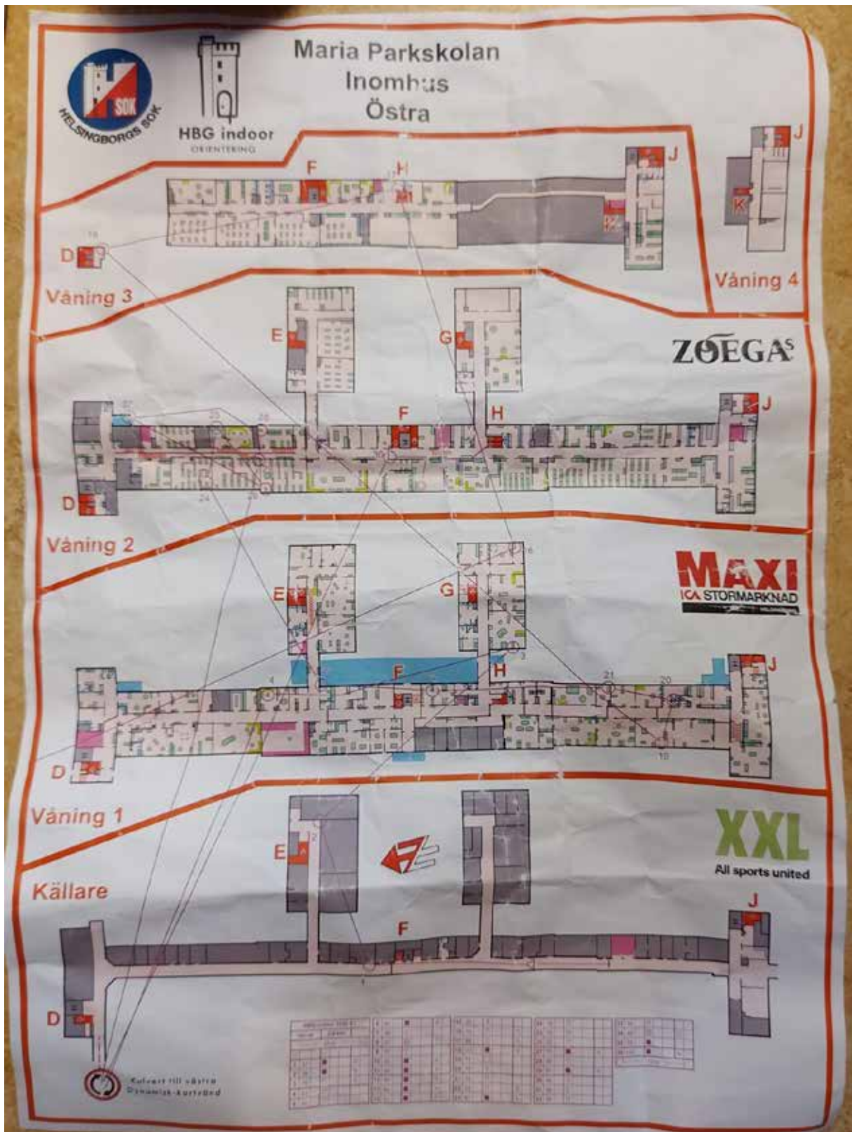
Halva Herrar-banan på E1.