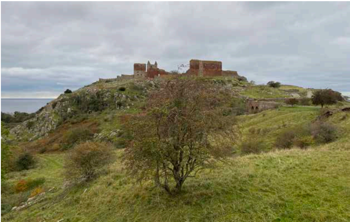
Borgruinen Hammershus är nog öns främsta sevärdhet men det finns massor av fina ställen.

Lördagens etapp gick centralt på ön i en del av Danmarks tredje största skog (!). Starttiderna var väldigt utdragna för klubbens deltagare med nästan två timmar mellan första och sista start. Vädret var mulet och lite småruggigt, vilket det tyvärr brukar vara när vi är på Bornholm trots att ön kallas för "Solskensön".