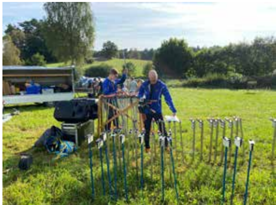
Utsättning av ett 80-tal kontroller. Edvin och Tomas Vensryd, två av flera kontrollutsättare.