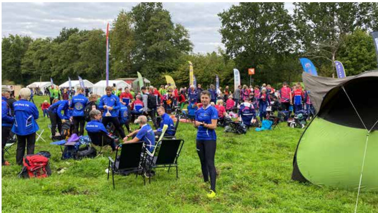
Eslövs FKs starka lag vid Fyrklubbs. En andraplats efter Andrarums IF och avancemang till grupp C blev resultatet.

Tränings- & Tävlingskommittén via Thomas Nilsson