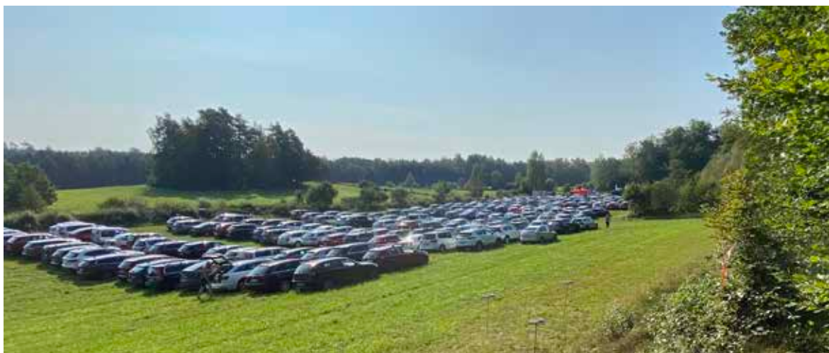
Tävlingens vackraste vy? Nästan hela ängen fylldes med perfekt parkerade personbilar i snörräta rader.

Finns det något vackrare än en äng med perfekt parkerade personbilar? Inte om man får tro Sven-Otto Jönsson med familj. – Disciplin och tydlighet är receptet om det ska bli bra, förklarar han.