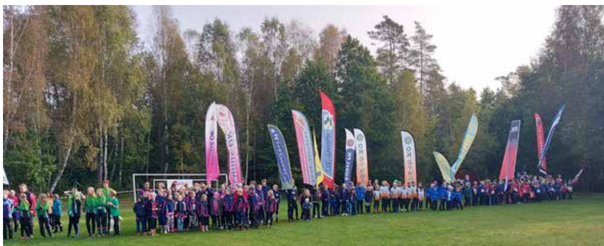
Klubbvis inmarsch på arenan.

Efter tävlingen var det dags att åka till Osby för Älgots Ungdomsnatta, där alla klubbar inkvarterades på Hasslarödsskolan för övernattnig i på hårt underlag i klassrum. Så värst mycket nattaktiviteter som namnet Ungdomsnatta antyder blir det inte, men väl lite aktiviteter som innebandy, killeball och labyrintorientering för de som hade mer spring i benen. För andra fanns det möjlighet att pyssla, titta på film, eller hänga i klassrummet och ta det lugnt. Det delades också ut priser för ungdomsserien vid en gemensam prisutdelning med mycket klubbkänsla, hejarop och applåder. Tyvärr räckte våra resultat inte riktigt till för att behålla division 1-platsen under 2024, så vi tar nya tag i division 2, och vi hade heller inga individuella pristagare.