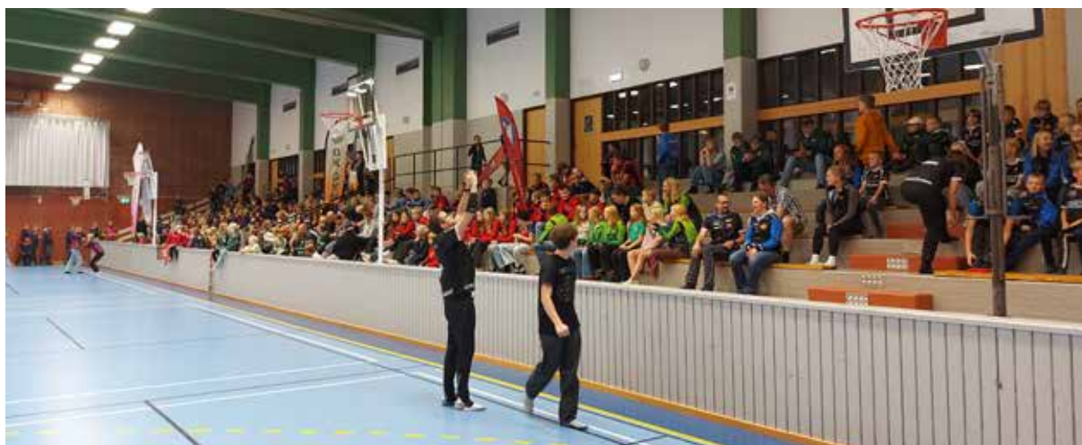
Prisutdelning SkOF Ungdomsserien.

En av höstens höjdpunkter är Älgots Hälg, som den kallades i år, en avslutningshelg för och med skånska ungdomar i centrum och som i år arrangerades av Hästveda OK och OK Gyngede. Lördagen började med individuella tävlingen Älgots Cup där 9 st av våra ungdomar sprang i skogarna kring Barnens By strax väster om Hästveda. Alla gjorde jättefina lopp och det är roligt att se den utveckling som våra ungdomar har gjort under året.