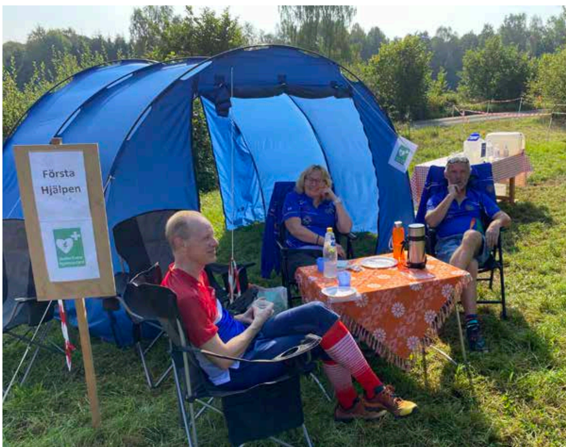
Tävlingens lugnaste avdelning var Första Hjälpen, precis som vi hoppades.