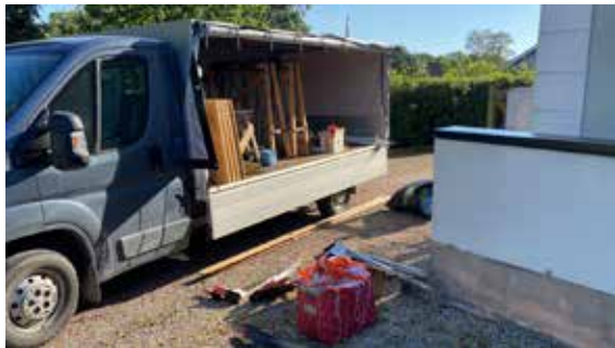
Inlastning av materiel från förrådet i Stehag.