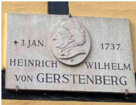
Heinrich Wilhelm von Gerstenberg (1737-1823)