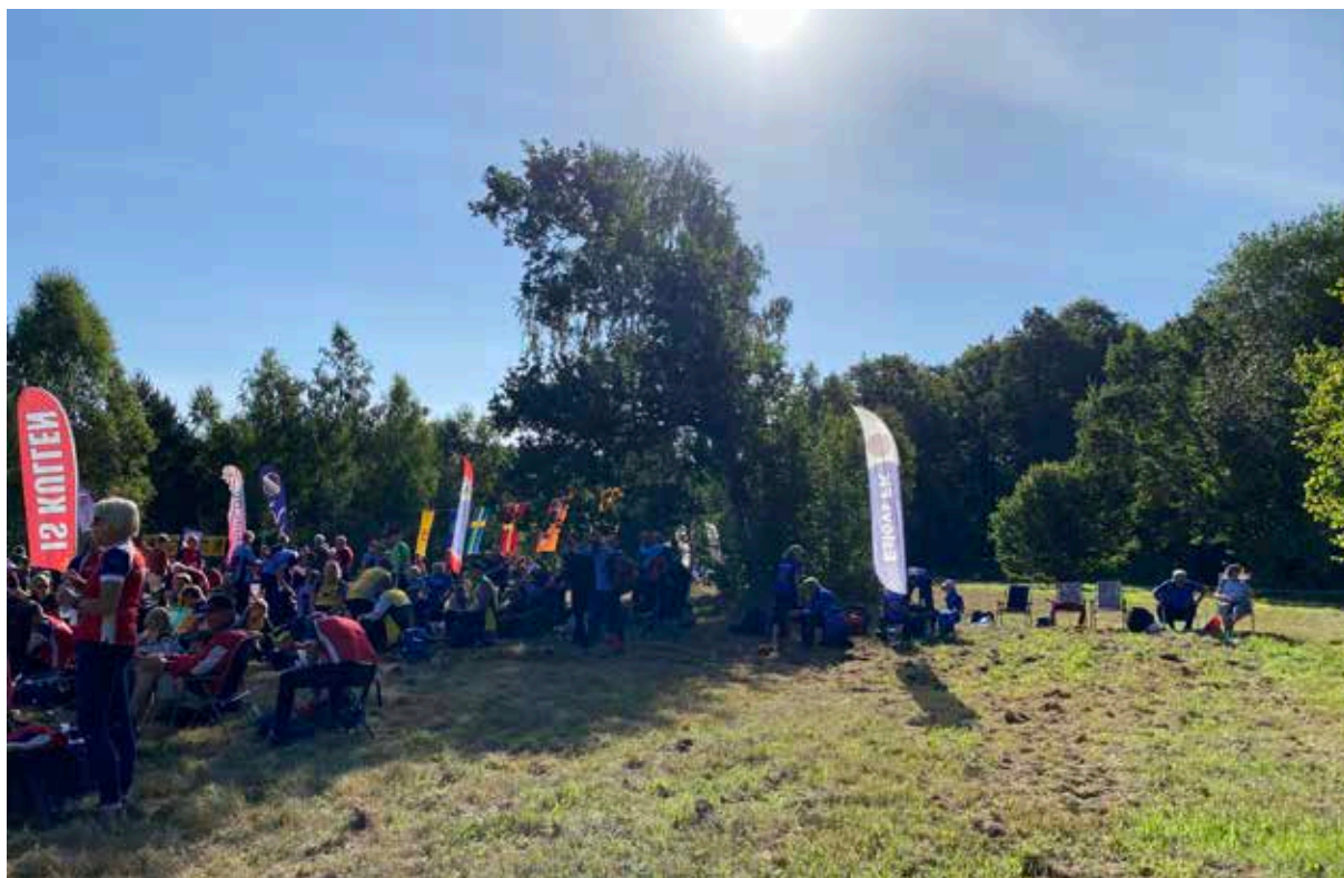
EFKs flagga lyste trots allt klarast av alla i det härliga sensommarvädret.