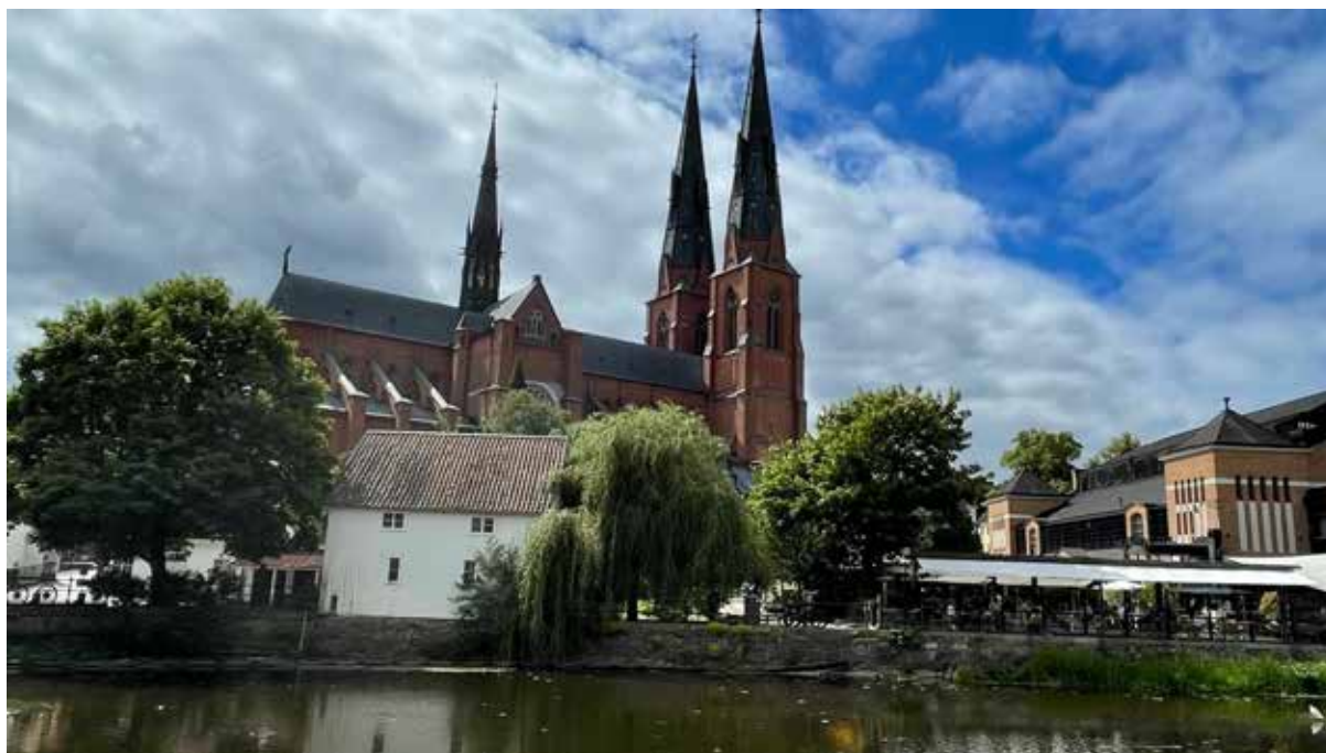
Centrala delarna längs Fyrisån med domkyrkan i bakgrunden

Uppsala bjuder på mycket historia och givetvis fick vi tid för lite kultur också. Det är en av Sveriges äldsta städer och har varit en politisk, ekonomisk och religiös centralort i området i över 1000 år. Sedan 1531 är Uppsala Svenska kyrkans ärkebiskopsstift och universitetet är det äldsta i Norden. På vilodagen blev det besök i Gamla Uppsala med kungshögarna, enligt mytologi och folkminne resta över de gamla sveakonungarna på 500-talet. Även domkyrkan där bla Gustav Vasa och Carl von Linné ligger begravda samt slottet förädrades med besök.