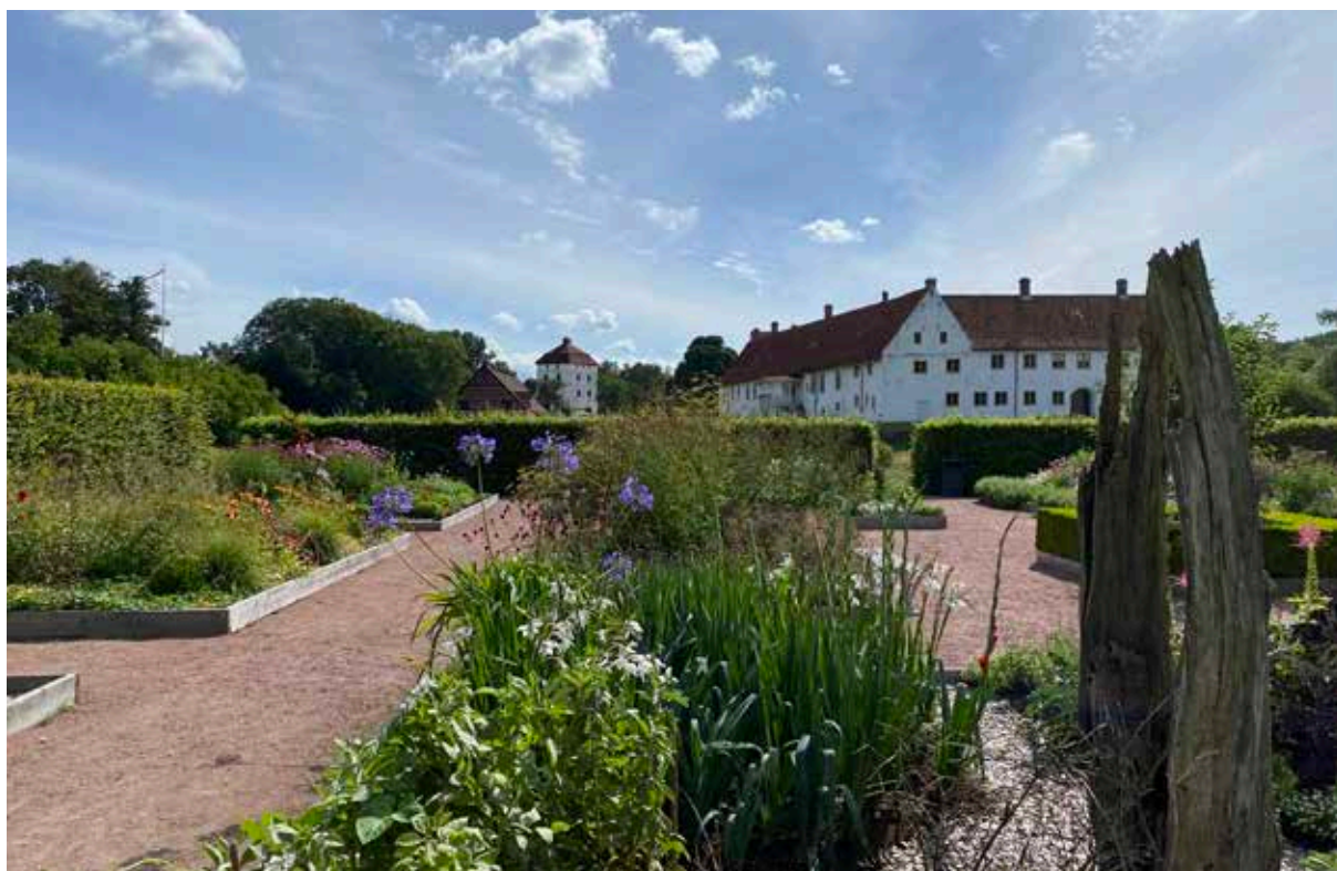
Hovdala slott – en mycket sevärd turistattraktion i närheten.