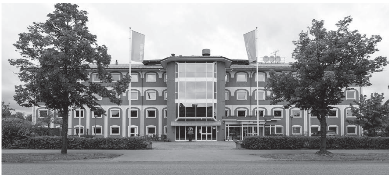
Eskilstuna Energi & Miljö.

» sedan år 2015 med en återbruksgalleria, där IKEAs etablering ger en extra dimension. I gallerian finns ett 20-tal kommersiella butiker. När kunden kommer med det som ska kastas, sker en genomgång. Sådant som kan repareras eller nyttjas ånyo plockas ur. En del kan säljas som det är – annat renoveras. IKEA lanserade återvinningsgallerian som första steget till ett cirkulärt IKEA. Och nyheten mötte 13 miljoner klick världen runt på bara några dagar.