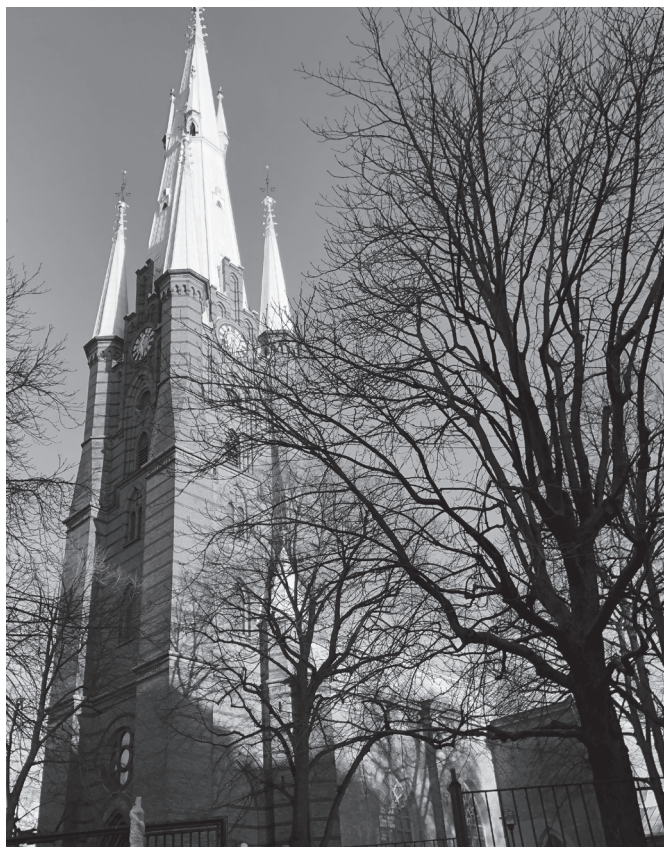
1884-86 byggdes det nuvarande tornet, 116 m högt, vilket är det näst högsta i Skandinavien efter Uppsala domkyrkas torn.

Hans berättelse om hur han blev fångslad av mulornas polis och svårt torterad var mycket stark och