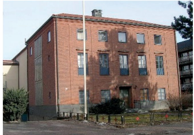
Frimurarehuset på Strandgatan är Eskilstunapojkarnas festlokal vid jubileumsträffarna.

Hjälp oss att fylla på Stipendiefonden! P.G. 461 93 76 - 9