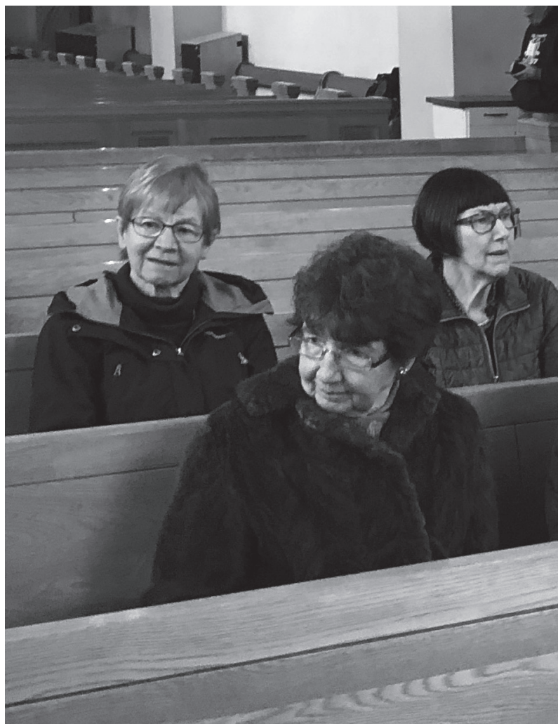
Föreningens höstmöte var förlagt till Klara kyrka i centrala Stockholm.

Kyrkan började snart byggas upp igen och redan våren 1753 var det mesta färdigt, så att kyrkan kunde återinvigas. Predikstolen är ritad av Carl Hårleman, 1766 kom Altartavlan upp, ritad av Jonas Hoffman, 1790 var altaruppsatsen klar, gjord av C.F. Adelcrantz. Änglarna, som omger altartavlan, är kopior i marmor efter gipsänglar skulpterade av Tobias Sergel och var klara 1904. Dopfunten är skapad av Thor Thorén år 1908. Målningarna i valven skapades av Olle Hjortzberg 1906-1907.