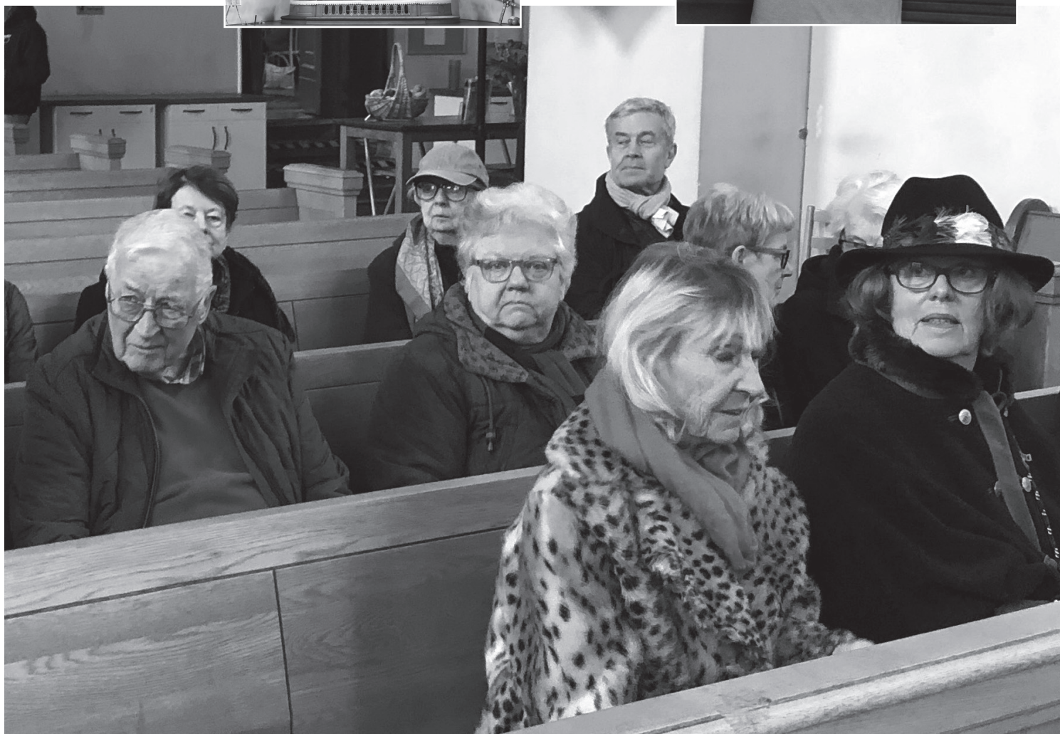
19 medlemmar hade mött upp och här ses några av deltagarna samlade i kyrkbänkarna.

2015 begravdes här Lennart Helsing, vår kände skapare av kluriga barnvisor.