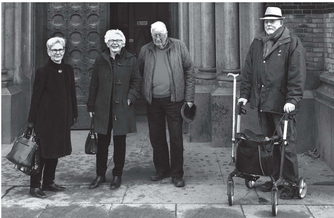
Här är några av deltagarna samlade på kyrktrappen innan besöket i den centralt belägna Stockholmskyrkan.