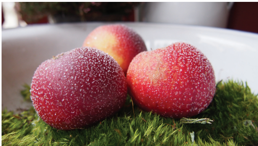
Frostiga juläpplen.

God Jul och Gott Nytt År önskar Redaktionskommittén