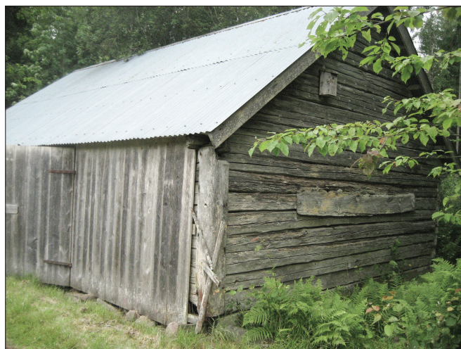
Salpetersjuderiboden i Boda.