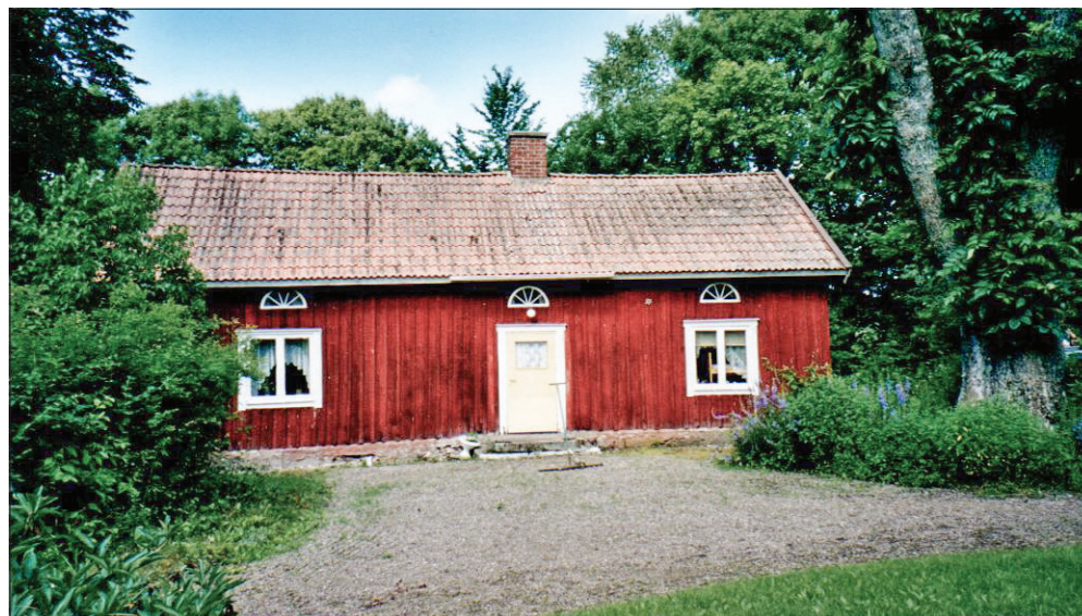
Krokans gård i Svenstorps församling, Västergötland