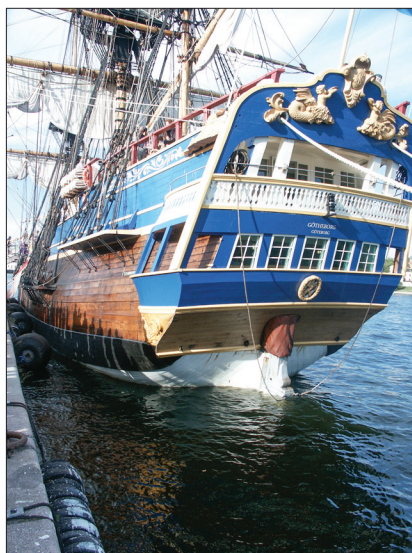
Ostindiefararen Götheborg vid Skeppsbron i Stockholm.

Ett budgetförslag för 2017 presenterades. Studieförbundet Vuxenskolan, som idag hyr en del av föreningens lokal i