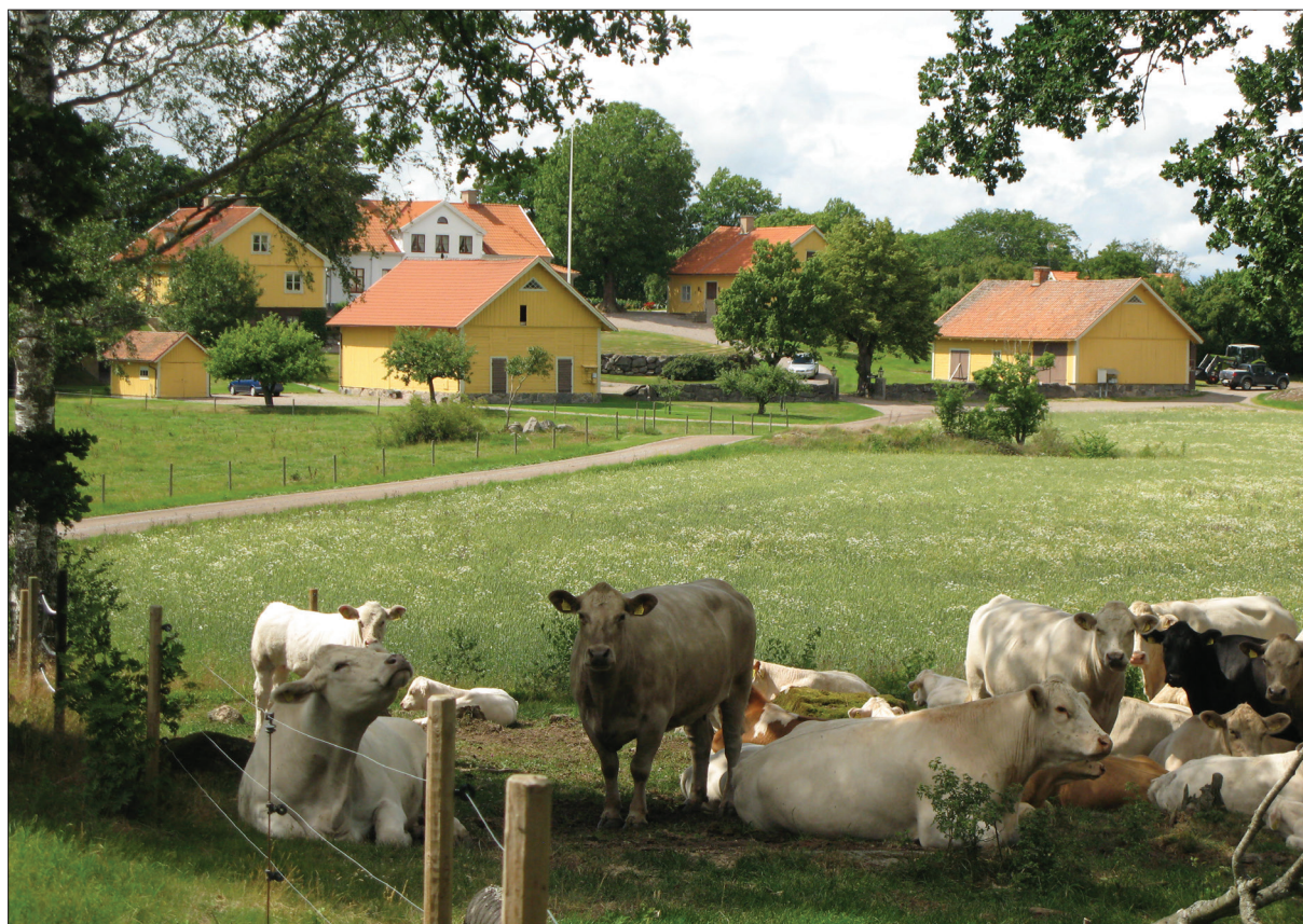
Lilla Greby i Askeby socken. Läs vidare på ss. 9-10.