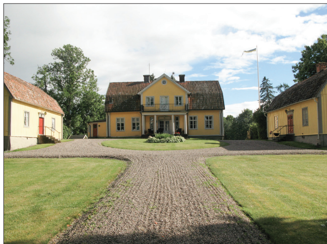
Biskopsberga herrgård i Allhelgona socken.

Vid besöket i Skänninge/Biskopsberga, tittade vi också in i turistinformationen där jag hittade en skrift med titeln "Hospitalet i Skänninge, Sveriges äldsta kända sjukhus". I den stod det att: "I svenska medeltida dokument avser hospital endast isolat för leprasjuka. Det äldsta omnämmandet på svensk mark är hospitalet i Skänninge. En handling från 1280-talet refererar bakåt, sannolikt till 1208." I samma skrift omnämndes också att det i en skrivelse från "Linköpings biskopsstol från 1178" att det skulle kunna finnas en koppling mellan Biskopsberga gård, Linköpings stift och hospitalet. Hospitalet skulle i så fall ha tillkommit mellan åren 1178-1208, alldeles i närheten av Biskopsberga.