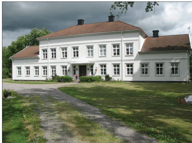
Mangårdsbyggnaden på Hjälmsäter i Örtomta socken.