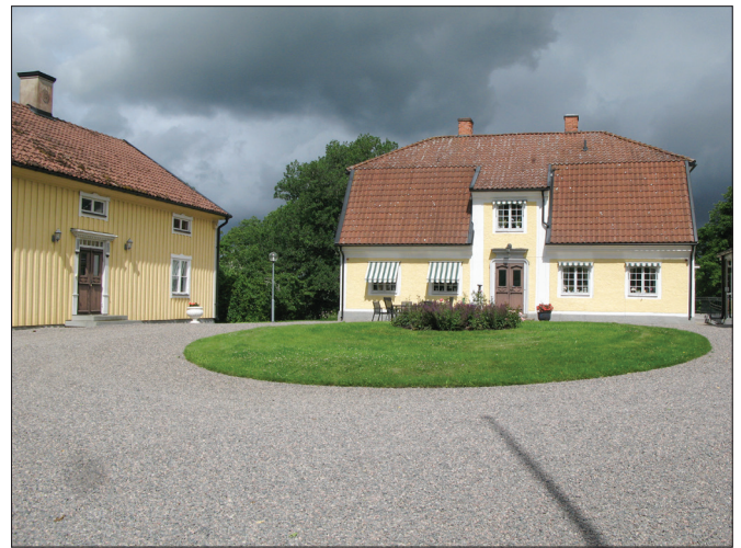
Finstad gård i Åtvid socken.