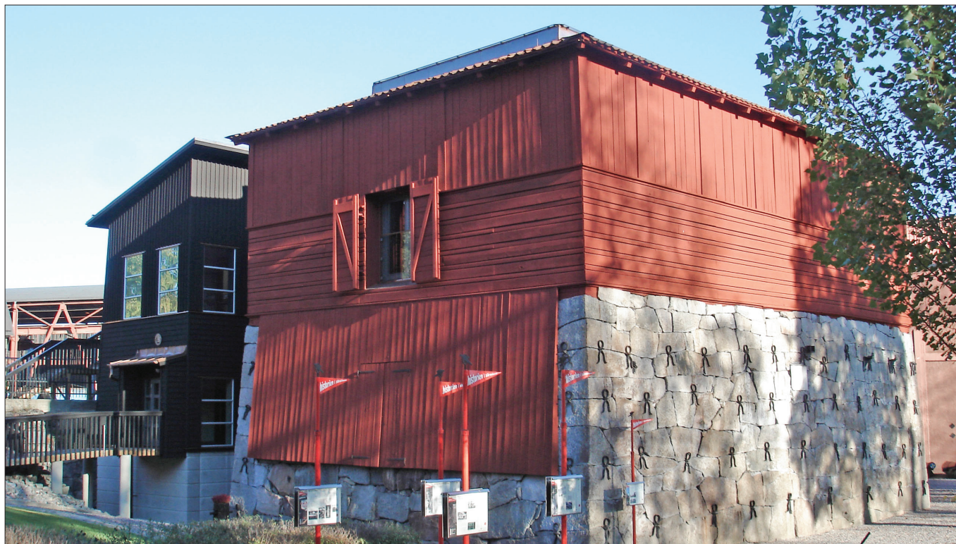
Masugnen och arkivet.

Många hembygdsföreningar har en hembygdsgård eller annan liknande lokal som sin centrala punkt. Hos Åkers hembygdsförening är den sammanhållande platsen sedan 30 år vårt museum. Här har medlemmar genom åren lagt ned otaliga timmar frivilligt arbete. Allt från att röja, renovera, ta hand om inlämnade föremål och bygga nya utställningar till att ställa upp som värdar och guider.