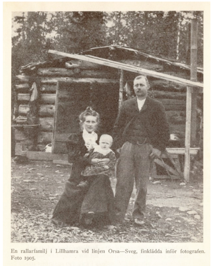
En rallarfamilj i Lillhamra vid linjen Orsa—Sveg, finklädde inför fotografen. Foto 1905.