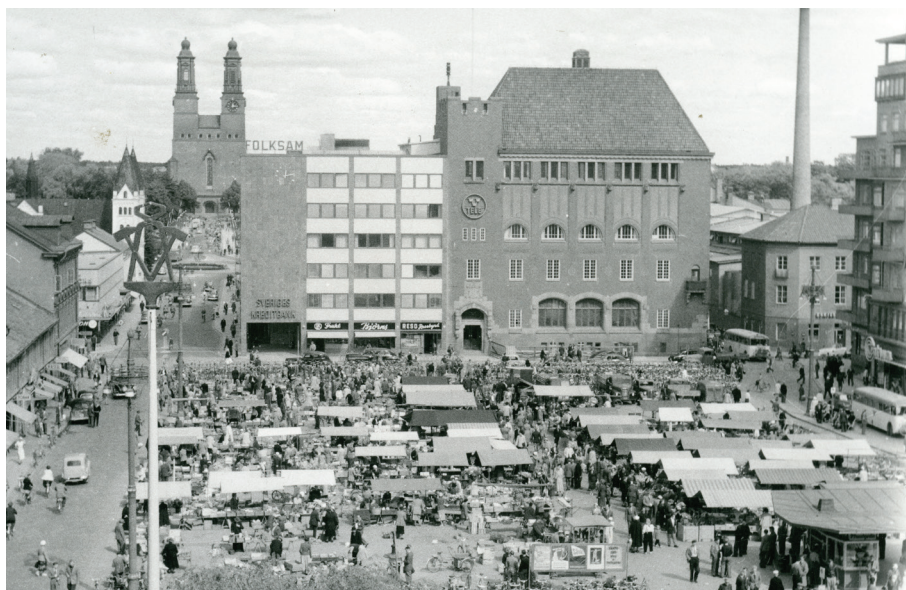
Fristadstorget med Post/Telegrafhuset till höger.