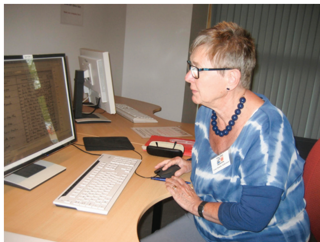
Författarinnan själv.