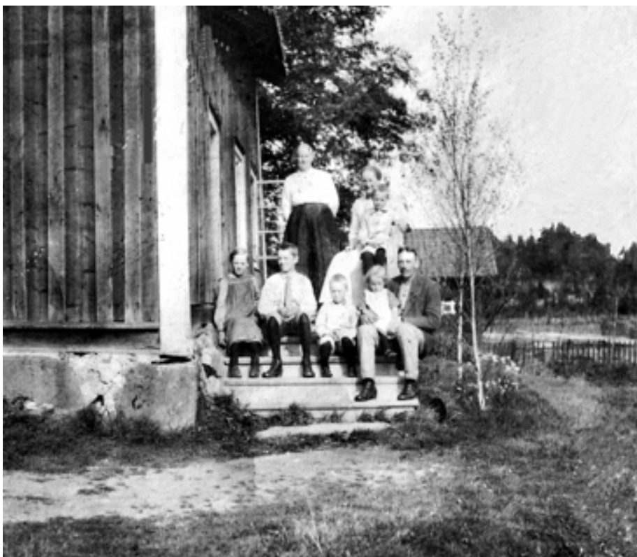
Efter bearbetning i fotoprogram