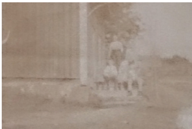
Före bearbetning i fotoprogram