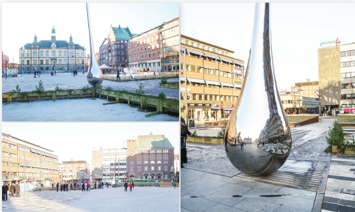
Nya Fristadstorget Eskilstuna, med den omtalade "pinnen".