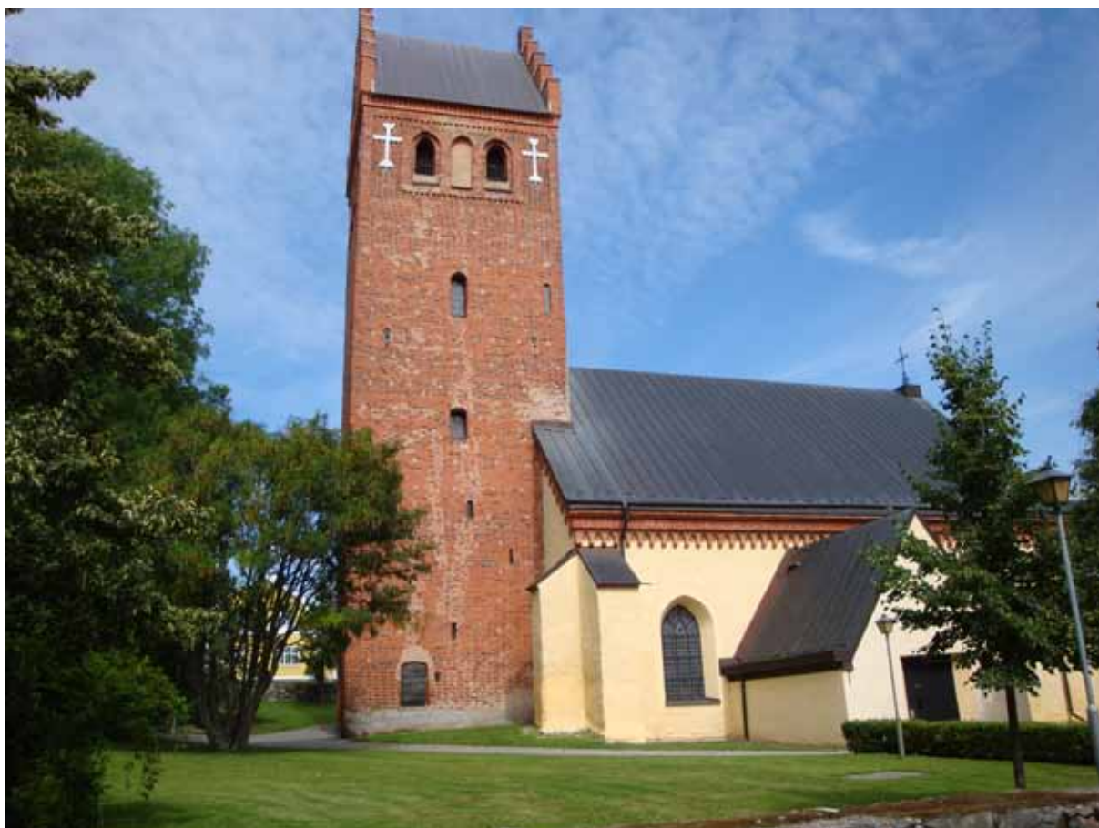
Torshälla kyrka.