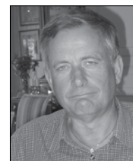
Nedtecknat av Göran Olofsson

Fakta fångat från Tunafors sportklubb och Eskilstuna Kuriren.