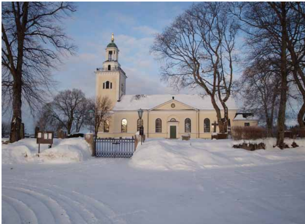
Öja kyrka..