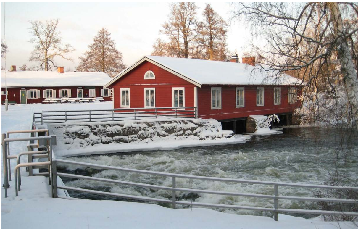
Skjulsta vid Eskilstunaån.