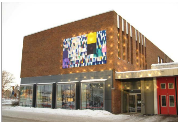
Stadsarkivet i Eskilstuna.