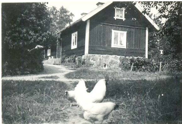
Gården Sundby på Fiholms ägor i Jäders socken.

När jag var i tonåren strax efter världskriget och när det började finnas bensin kom det en gammal dam in till oss och ville se huset där hon bott en gång. Hennes barn hade följt med henne på en nostalgiresa till hennes barndomstrakter. Hon berättade för oss att hon som femåring flyttat in i huset, som vi bodde i. Då var det alldeles nyuppfört på den nya platsen. Hon tyckte det var underbart att återse huset som hon en gång bott i.