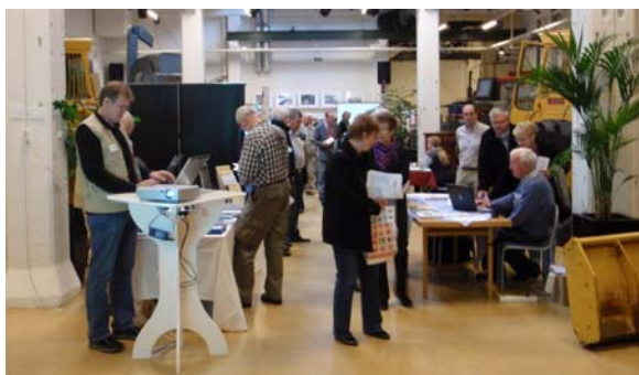
Många valde att besöka årets släktforskmässan.

Och en mer lämplig inramning för mässan kunde inte ha valts. Liksom släktforskarerna söker sig bakåt i tiden för att finna sin historia, så kunde besökarna här också söka historia bland de traktorer och andra arbetsmaskiner som finns utställda i museet i flera generationer bakåt i tiden.