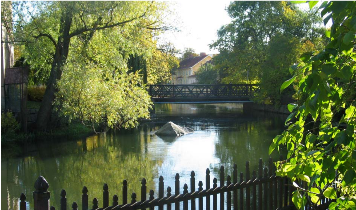
Eskilstunaån vid Faktoriholmarna.