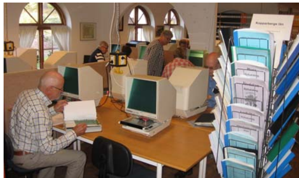
Full aktivitet i släktforskarummet

Som en bonus, före hemfärd, fick vi en matnyttig och timslång genomgång av GenLines senaste nyheter av Per Norberg.