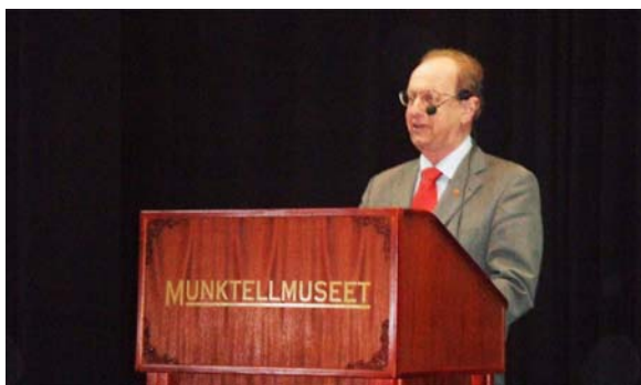
Landshövding Bo könberg.

Och intresse fanns inte bara hos besökarna utan även hos de organisationer och företag som på ett eller annat sätt är engagerade i släktforskning. Förutom de välkända företagen som tillhandahåller program och datautrustning för släktforskarerna fanns även ett flertal hembygdsföreningar med flera representanter. Sammanlagt hade ett drygt 40-tal utställare visat intresse att delta.