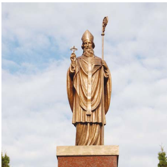
Statyn över St. Eskil på Kyrkogatan i Eskilstuna.