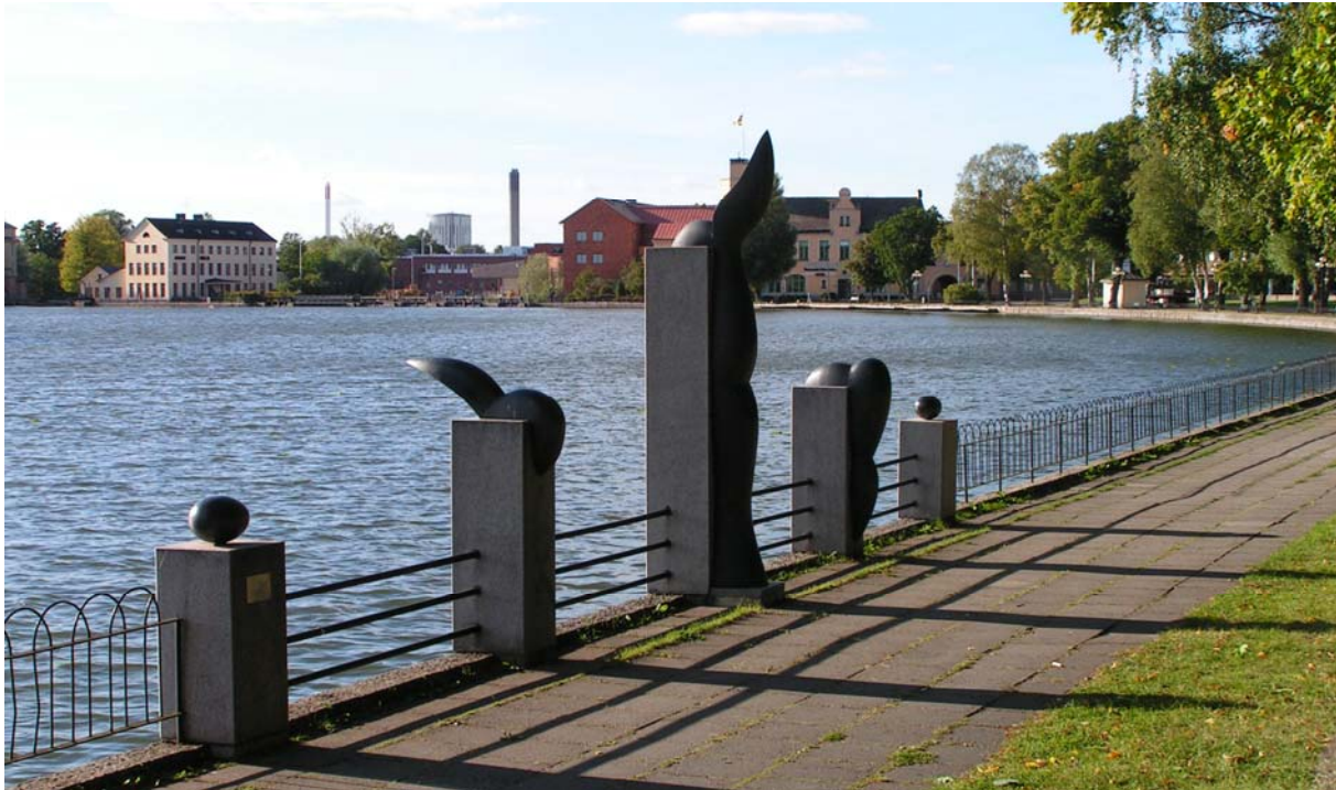
Vår längs eskilstunaån.