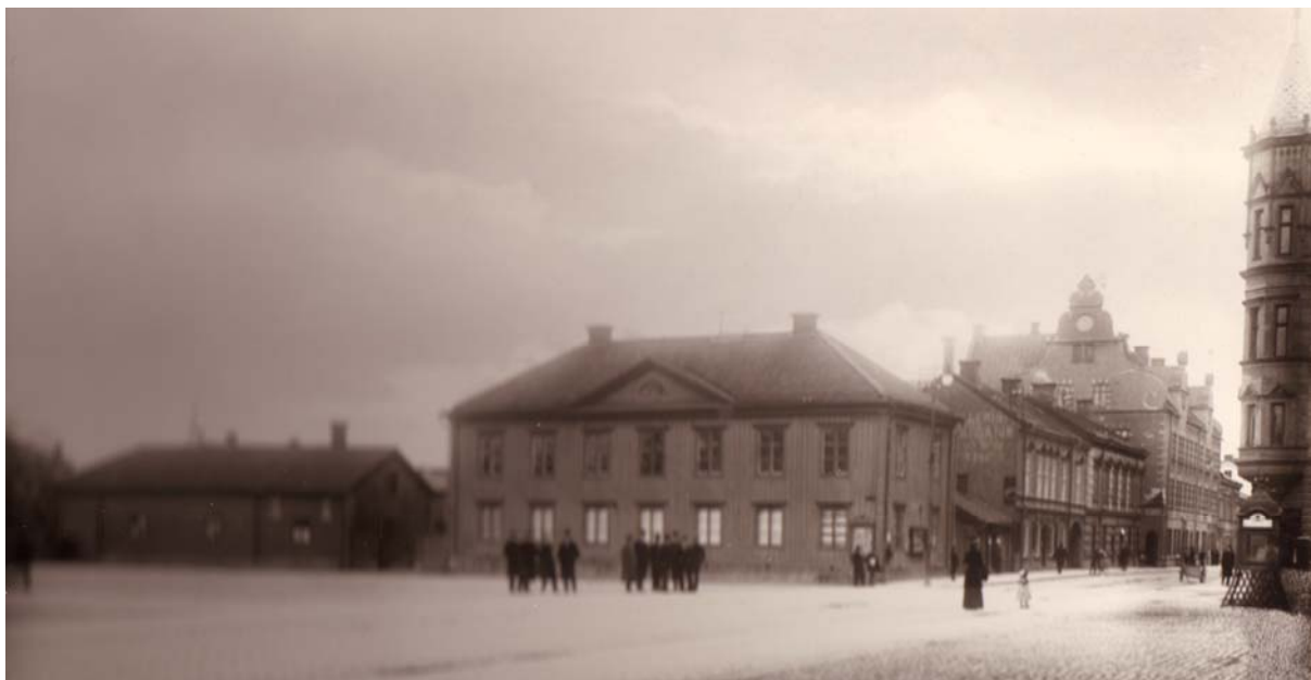
Fristadstorget i Eskilstuna tidigt 1910-tal.