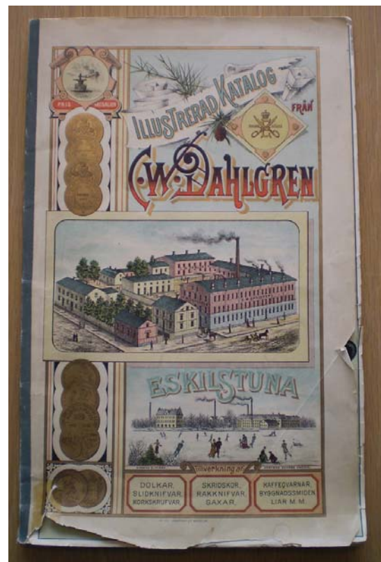
Priskurant (finns på Företagsarkivet).