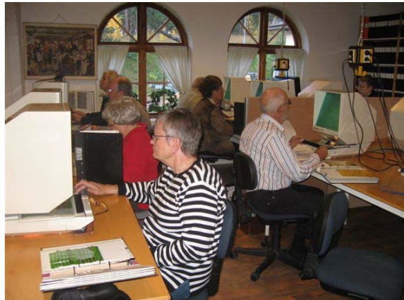
Koncentrerade släktforskare.

lösas. Efter middagen fortsatte jag att forska fram till 21-tiden.