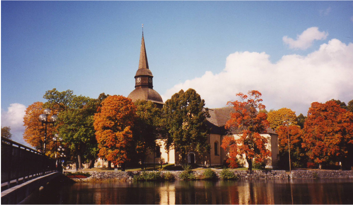
Fors kyrka i höstkrud