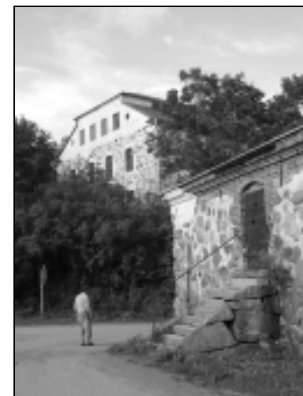
Fotot är taget nerifrån bron över forsén vid Sjunby där man ser den gamla kvarnen och slottet i bakgrunden.

PS I skrivande stund kollade jag stavningen av alla ortnamnen på Internet och fann väldigt mycket information. Tur att jag inte gjorde det före resan, då hade jag inte fått någon överraskning. Jag har dessutom fått en diskett från