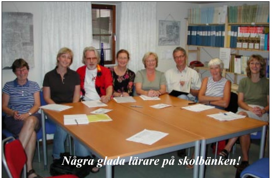
Några glada lärare på skolbänken!