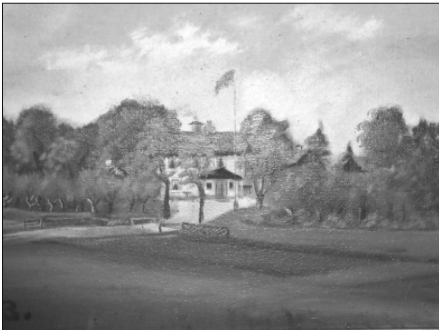
Detalj av målning av en gåramålare. Bilden föreställer Rörviks gård i Österåker, Vingåker, Södermanland.