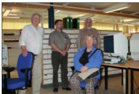
Släktforskare i trans, lyssnande på: