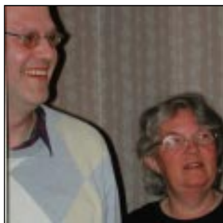
Sover Leffe redan?