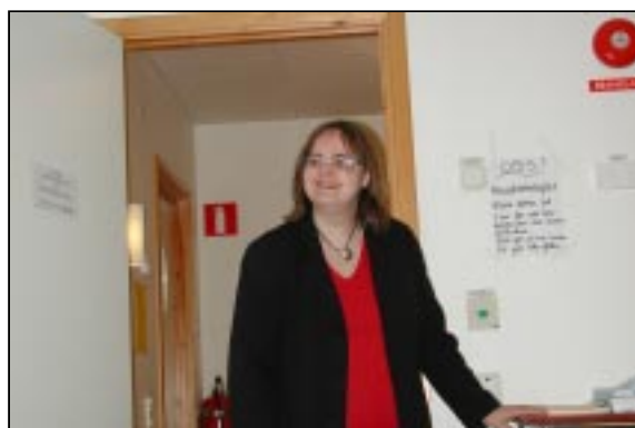
Vår guide och värdinna (Arkivarie)