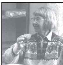
Gunvor själv i fikatagen