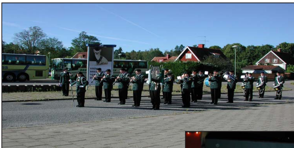
Ett litet bildkollage från Släktforskar dagarna i Linköping

Informationsblad för Eskilstuna - Strängnäs släktforskarförening Nr. 3 år 2000