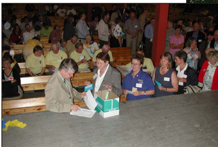
Sluten omröstning för val av ny förbundsordförande