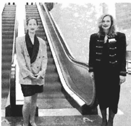
Det här hade kunnat vara våra lokalvärdar om bara kameran hade fungerat.