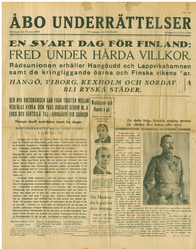
Första sidan av Åbo Underrättelser från torsdagen den 14 mars 1940.