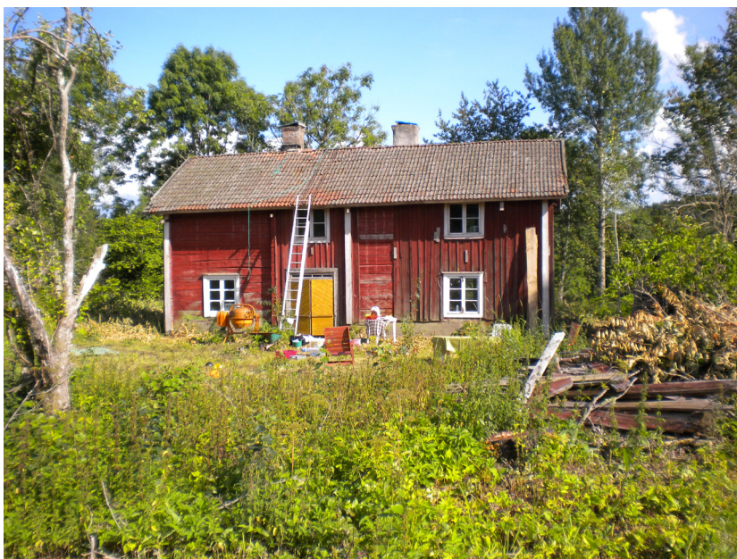
Gästgiveriet i Ödshult.

Det säger sig självt att det lokala gästgiveriet blev en given träffpunkt för ortens befolkning. Här kallades till tima och urtima ting, här avhölls marknader och auktioner, här ackorderades och skvallrades, här söps det och här slogs det.