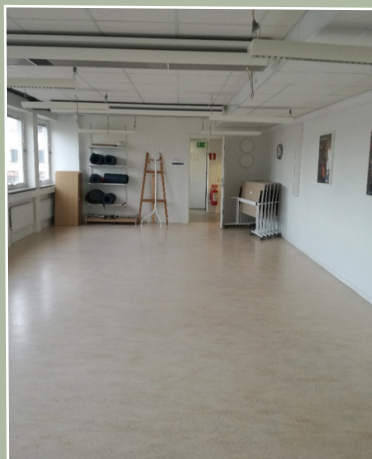
Ett större rum, danslokal med spegel på ena kortväggen, men som man med biosittning kan få plats med ca 40-50 personer