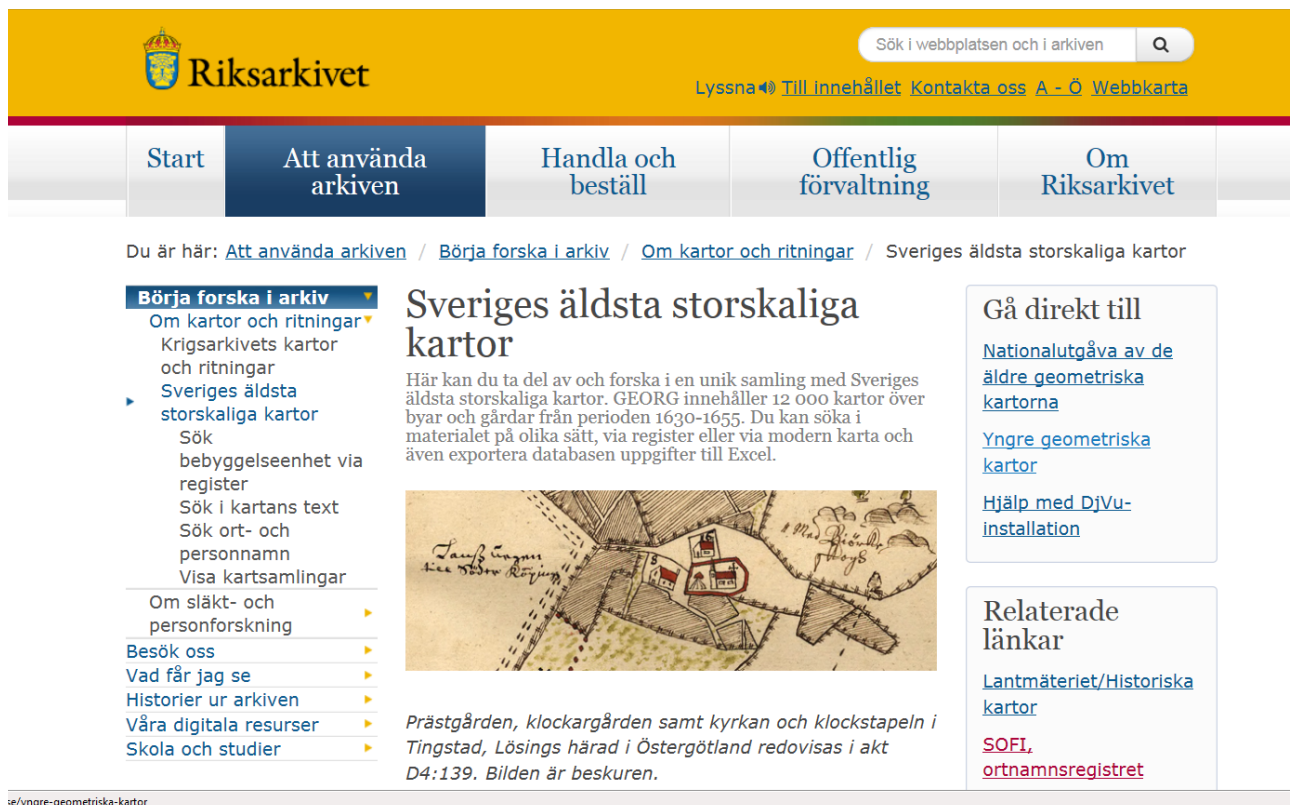
Skärmdump från Riksarkivets hemsida (dec. 2016) som visar sökvägar och relaterade länkar