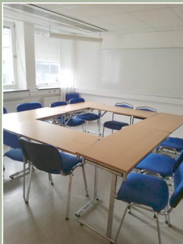
Ett konferensrum för max 10-12 personer