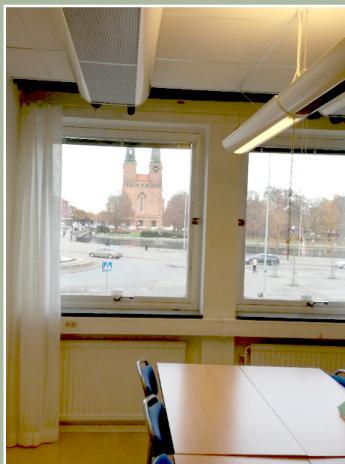
Utsikt från "vårt" rum