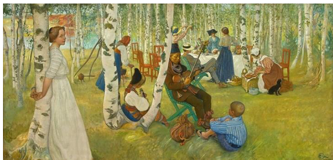
Frukost i det gröna 1910-1913