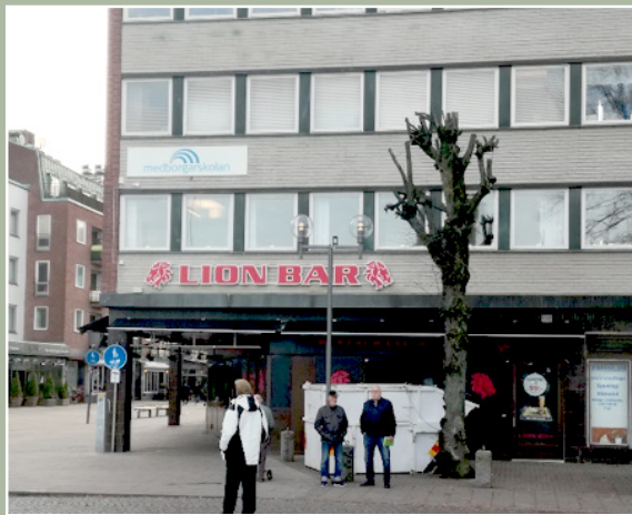
Medborgarskolan på J A Selanders gata 1 i Eskilstuna