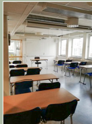
Ett större rum med ca 20 platser (biosittning ca 40 platser)