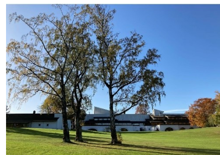
Konventum Conference Centre Erling Jensens Vej 1, 3000 Helsingør

Konventum is a modern Conference Centre with a superb atmosphere and is praised for its unique architecture, extensive art collection and Danish design.