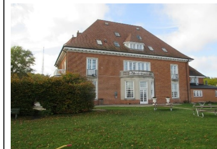
Danhostel Helsingør Nordre Strandvej 24, 3000 Helsingør

Le centre de conférence est situé dans une nature de grande beauté à 300 mètres de Øresund et à 3 kilomètres de la gare de Helsingør. Toutes les chambres à un lit et twin sont charmantes et accueillantes avec toutes les commodités modernes comme douche, cabinet de toilette, séchoir, télévision satellite et wifi gratuits.